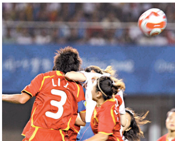
▲中國隊球員（紅衫）與日本隊球員爭頂