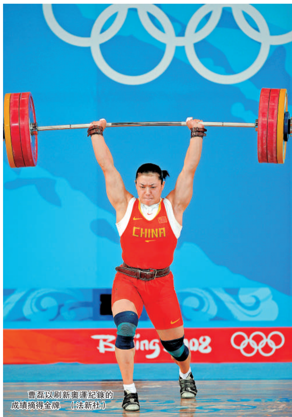
曹磊以刷新奧運紀錄的成績摘得金牌

挺舉較量，曹磊猶如超然世外，首把便舉起147公斤，這一重量比原定的輕了8公斤。挺舉第二把，曹磊將154公斤的槓鈴舉過頭頂，創造了新的奧運會紀錄，原奧運會紀錄為150公斤。隨後，她試圖舉起159公斤，衝擊挺舉世界紀錄。可惜未能成功，總成績停留在282公斤。