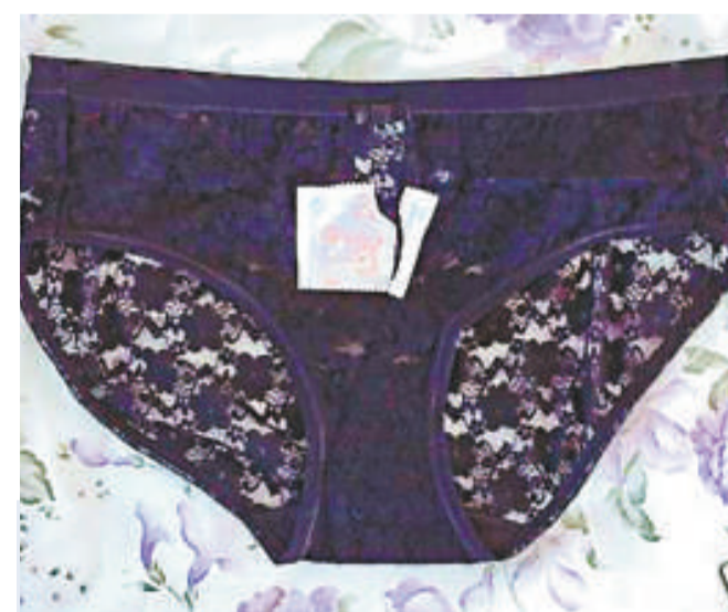
▲被拍賣的安全套包裝袋和內褲照片

塔格特說，諾里斯因違反「消音令」，而在上周被下令罰款及支付堂費，合共三百英鎊。記者暫時未能聯絡到欣頓和諾里斯置評。