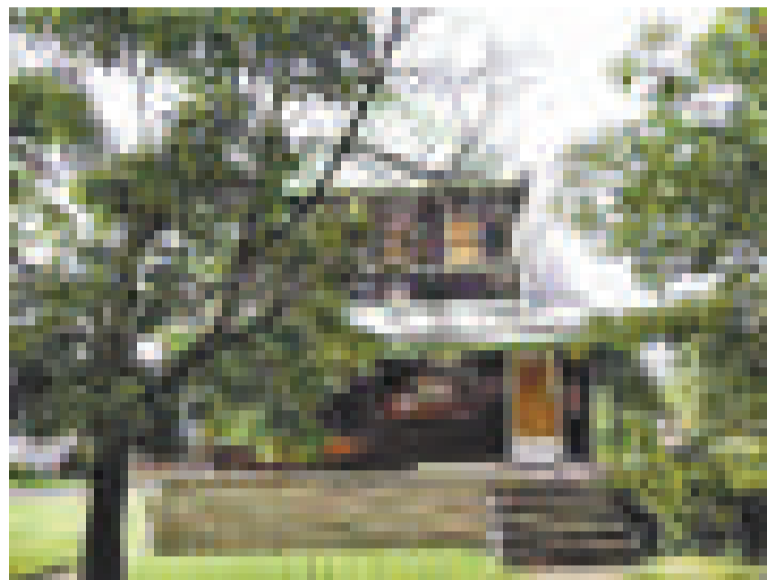
▲以一美元出售的底特律市特拉維斯大街8111號房子