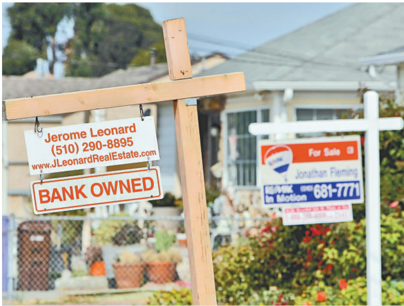
▲次按危機使美國大量房屋成為銀主盤

事實上，這座房子並不是底特律市唯一一座只賣一美元的住宅，底特律市還有另外兩座住宅以及一塊空地也只售一美元。底特律市其他一些廢棄的空房，如今很多售價也大多只有一百美元（約合港幣七百八十元）左右，而花三百美元則可以在底特律買到一大塊空地。