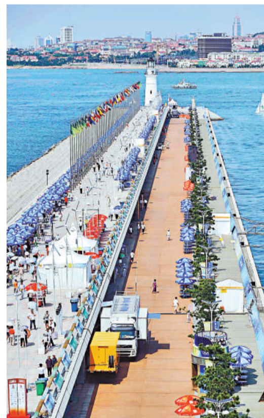
▲位於青島奧帆中心內的「觀衆大壩」

吹着海風，傍着大海，欣賞國粹，觀眾還可以聆聽到「金聲玉振」首次在奧帆中心奏響，一起分享獲獎運動員的勝利。