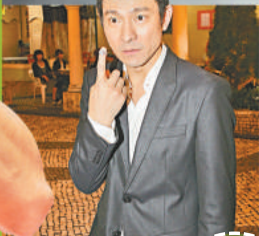
▲華仔甚感可惜(資料圖片) ▼關心妍期待劉翔再奪獎