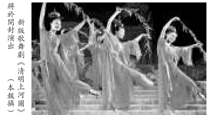
將於開封演出新歌舞劇《清明上河圖》