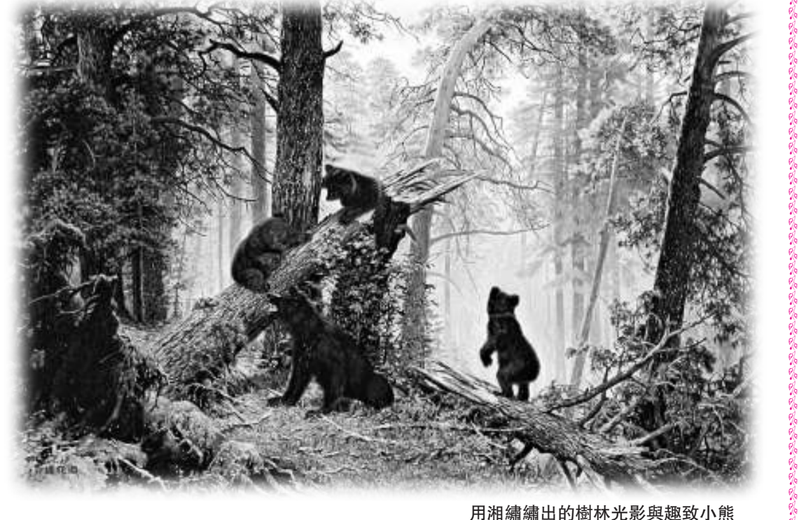
用湘繡繡出的樹林光影與趣致小熊