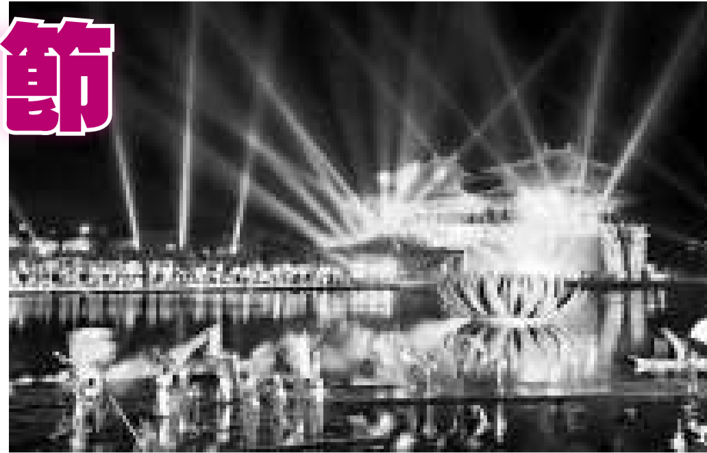
大型水上實景演出《大宋·東京夢華》將在開封公演為藝術節助興