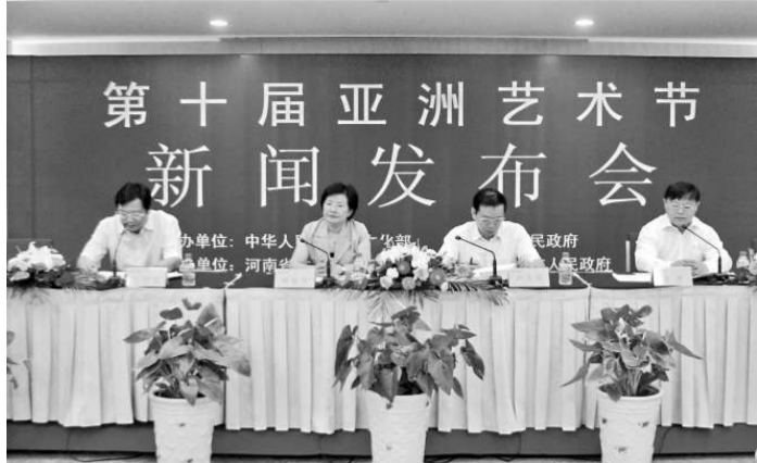
第十屆亞洲藝術節舉行新聞發布會

【本報記者白炳坤、楚長城鄭州報導】第十屆亞洲藝術節將於今年九月二十六日到十月八日在中原文化大省河南省的鄭州、開封兩地舉辦，是首次在中部地區，在金秋時節帶來藝術盛筵。 亞洲藝術節是經國務院批准、新中國成立以來創辦的第一個國家級區域性國際藝術節，自一九九八年在北京創辦以來，已先後在北京、杭州、長春、佛山、南通等城市共舉辦了九屆。