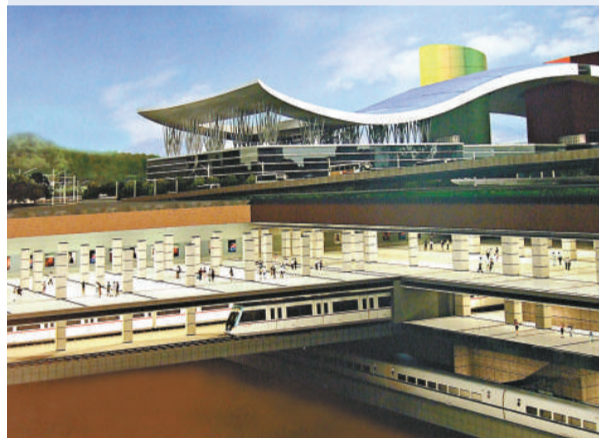
▼福田火車站剖面圖

十點五億元，將於二〇一一年六月建成。另外，在周邊也配套了許多地面公交、的士站及社會車輛停車場，方便乘客使用。