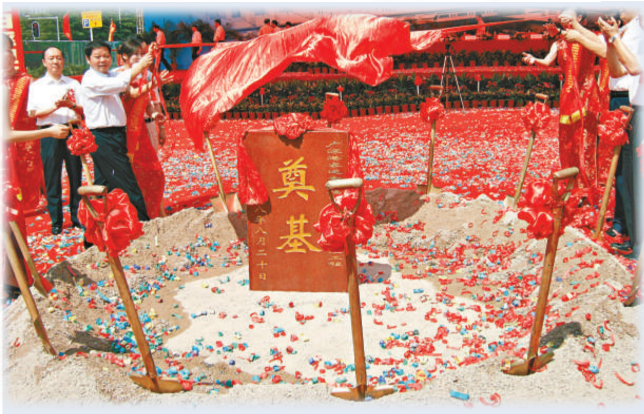
▲廣深港鐵路客運專線福田站暨福田綜合交通樞紐工程正式開工

福田綜合交通樞紐工程中的城市軌道2、3、11號線均在此設站，是深圳市第一個主要依靠軌道接駁換乘的交通樞紐。廣深港客運專線與三條地鐵線在地下二層共享換乘大廳，實現無縫接駁。其中，地鐵3號線福田站位於民田路與深南大道交叉口處，為地下三層側式站台車站，車站總長約一百九十八米，寬二十五米；2、11號線福田站位於深南大道北側，為地下二層島式車站，車站總長約七百一十米，寬四十三米。三座地鐵車站總建築面積約八萬平方米，總投資約三