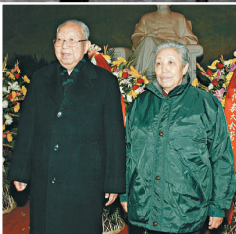
▲ 2003年12月26日，華國鋒和夫人到北京毛主席紀念堂紀念毛澤東誕辰110周年（中新社）