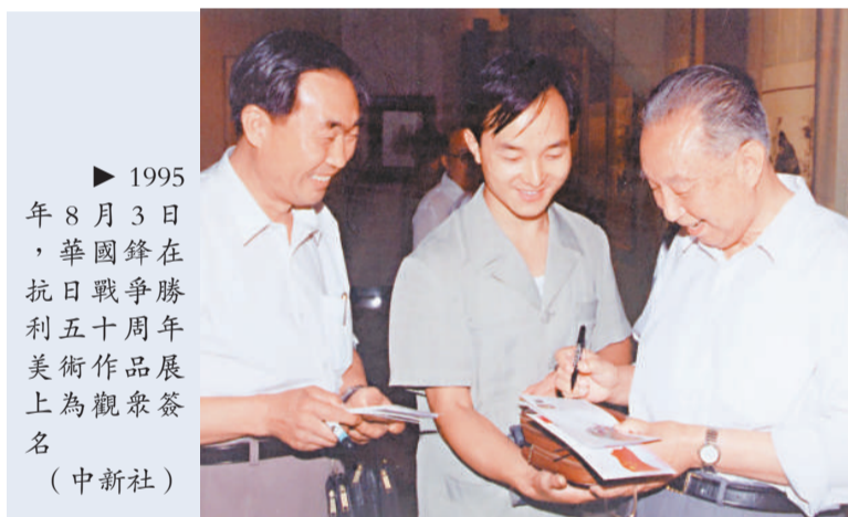
► 1995年8月3日，華國鋒在抗日戰爭勝利五十周年美術作品展上為觀眾簽名