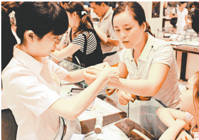
受國際金融市場影響，內地金價大幅下挫。許多市民在商場櫃檯前排起長隊購買黃金及金飾。