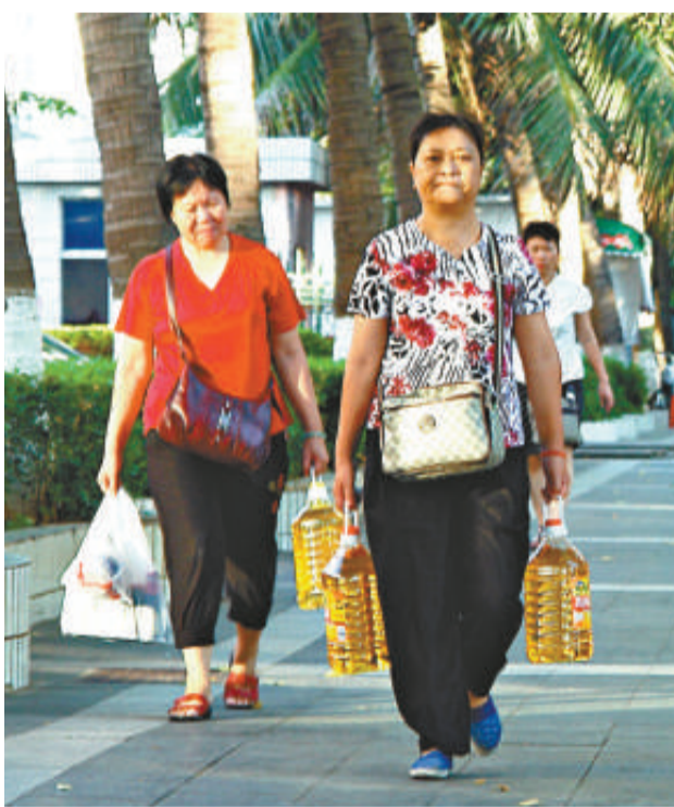
二十日，幾位海口市民採購食用油後走在回家路上。由於原材料價格持續走低，食用油價格也出現了較大幅度的回落