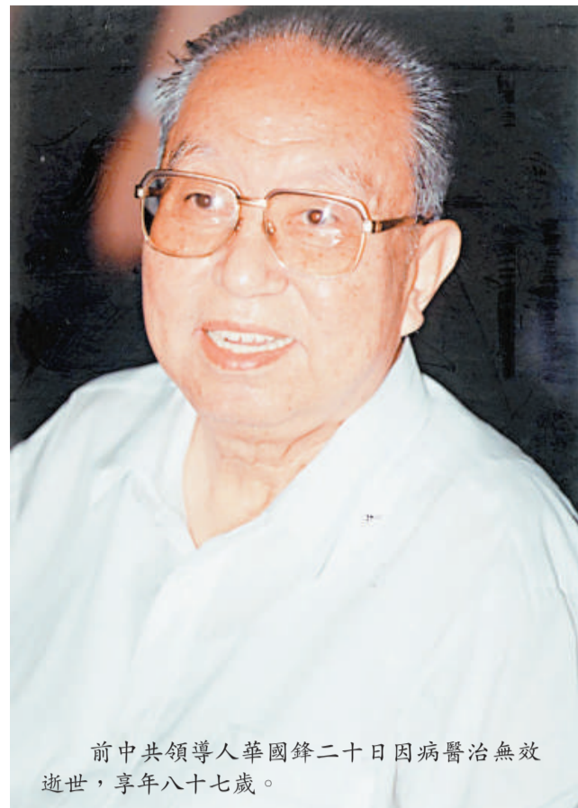
前中共領導人華國鋒二十日因病醫治無效逝世，享年八十七歲。