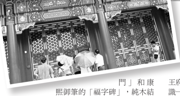
▲恭王府府邸開放後，遊人能夠一睹其正面的非凡氣派