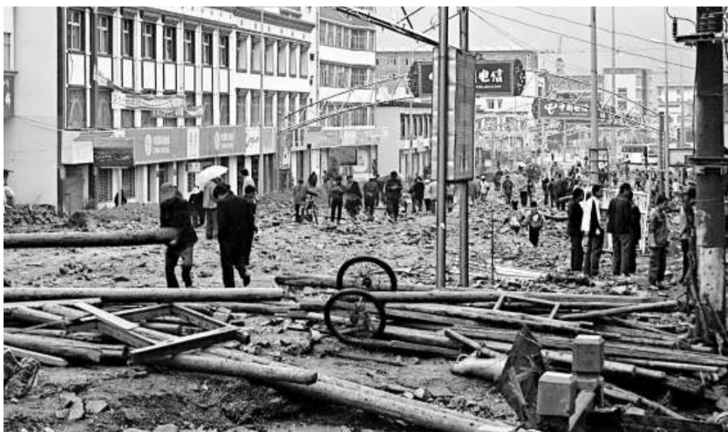
夏河縣城主幹道拍攝的暴雨泥石流災害過後的情景

中央氣象台專家提醒，由於「鸚鵡」登陸在即，廣東、福建、浙江等地要密切關注其預報預警信息，做好人員轉移的準備工作，組織海上船隻回港避風，提前做好颱風帶來的大風、強降雨及其引發的城鄉內澇、山洪、泥石流等災害的應對措施。