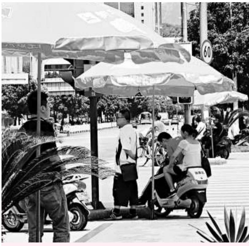
今年第12號颱風「鸚鵡」逼近閩粵沿海，受颱風和副熱帶高壓共同影響，福建「熱情」加劇，該省氣象台接連發布颱風藍色預警和高溫橙色預警 (新華社)

目前，今年第12號颱風「鸚鵡」中心位於福建廈門市東南方約760公里的海面上，近中心最大風力13級，最大風速每秒40米。據中央氣象台預計，颱風「鸚鵡」的中心將以每小時15至20公里的速度繼續向西偏北方向移動，強度有所加強，並將於今日夜間進入南海東北部海面，預計颱風「鸚鵡」未來向福建南部沿海到廣東東部沿海靠近，最大可能於22日白天在廣東東部沿海登陸。