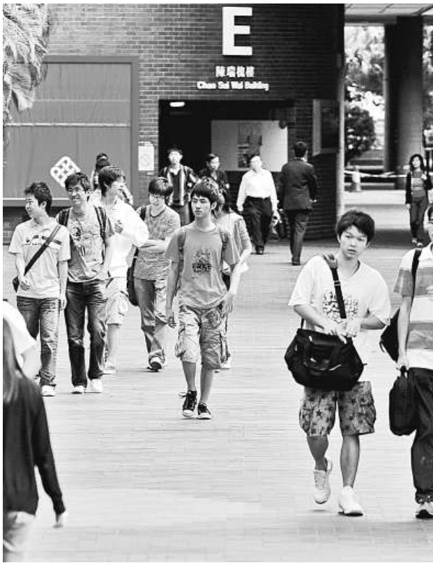
教資會公布，應屆大學畢業生參加 IELTS 的總平均分，較去年輕微下跌

IELTS 為國際認可的英語測試工具，本港自二〇〇二年開始採用，近年全球每年參與考試的人數已達到一百萬人次。而在考試中取得六點五分或以上，並在同一次考試中各項個別分級取得不低於六分的考生，其成績可獲承認等同本港政府綜合招聘考試英文「二級」的成績。