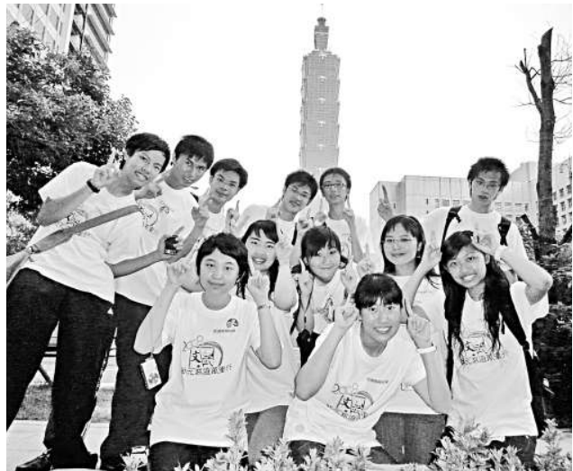
狀元在全世界第二高的大樓「台北101」拍照留念