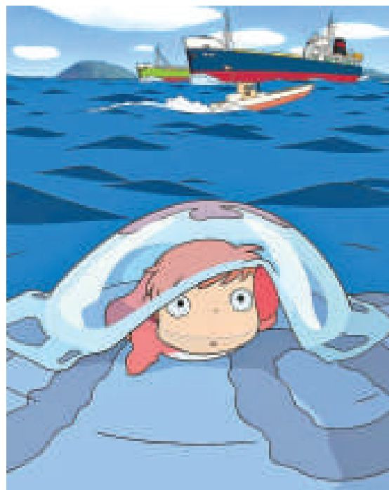
▲《崖上的Ponyu》終於突破百億日圓票房，為日本電影打下強心針 ▶瑛太被攝得與一名貌似鮑香的女性返家，又傳出新緋聞