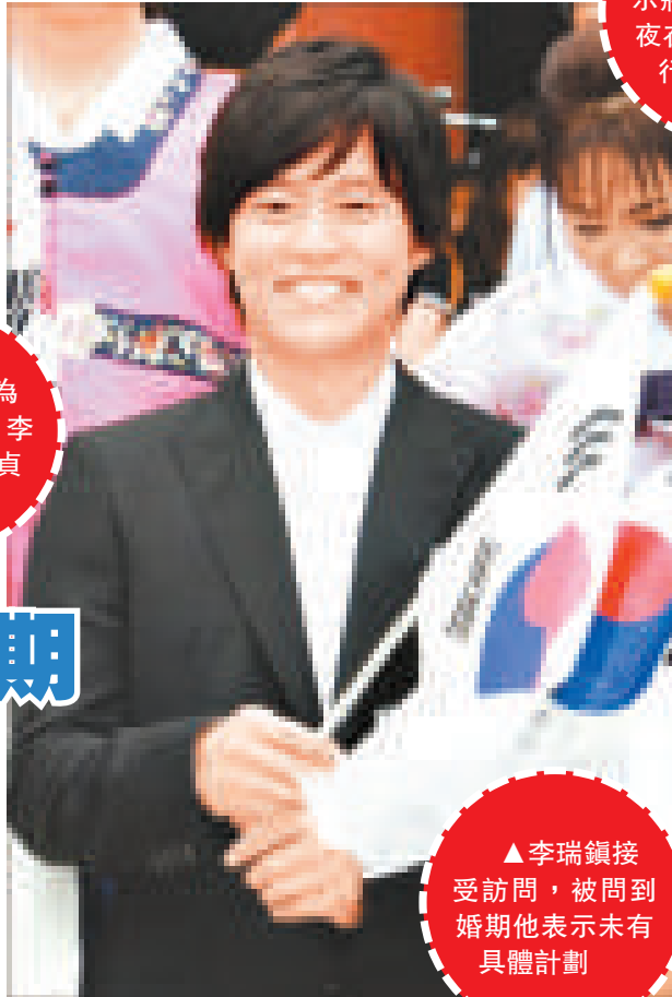
▲李瑞鎮接受訪問，被問到婚期他表示未有具體計劃

李瑞鎮和金貞銀這對韓國娛樂圈金童玉女，何時結婚一直是韓國傳媒的關注焦點。最近李瑞鎮接受KBS 2頻道清談節目訪問時，被問及他和金貞銀的婚期。李瑞鎮表示他現時仍未有具體計劃，並笑說將來舉行婚宴的話一定會大宴親朋及傳媒，規模將會非常浩大。現時他和金貞銀仍非常享受甜蜜戀愛生活，經常都在金貞銀住所附近的酒吧約會談天。