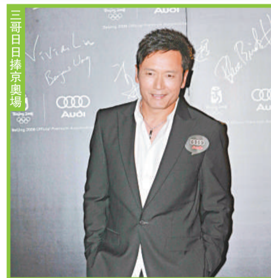
三哥日晚獨自出席，主要來聽音樂亦可以看車。