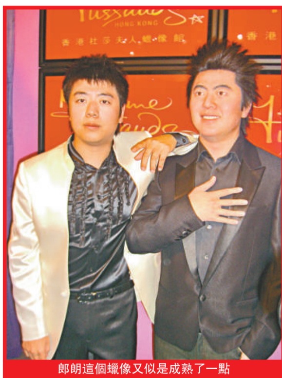
郎朗這個蠟像又似是成熟了一點

又他的蠟像造型是西裝配襯牛仔褲，並穿上特別為他設計及命名的波鞋，左手插褲袋，右手則按着胸口，郎朗笑言這是他每次演奏完畢謝幕的動作，覺得蠟像的神態像，只是臉不太像，似他的哥哥，但好開心未來有許多遊客可以跟他的蠟像合照。對於他成功以內地專才身份申請來港，但他暫時未想定居香港，現時會定居紐約。又昨晚他已返回北京，為未來在倫敦的首次演奏會做準備。