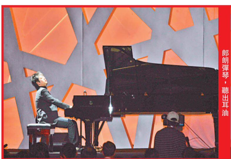
郎朗彈琴，聽出耳油