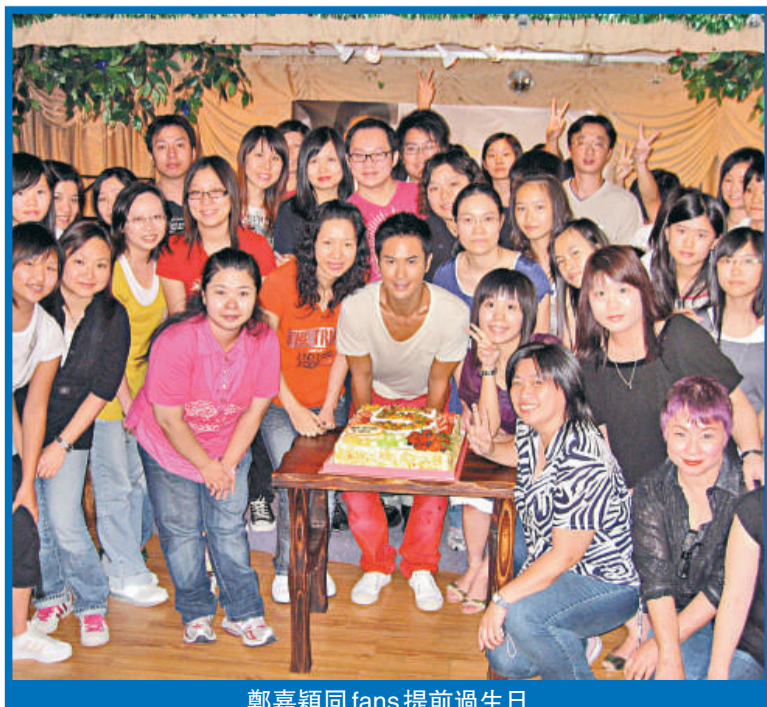
鄭嘉穎同 fans 提前過生日

在生日會前嘉穎都呼籲 fans 不要買禮物給他，寧願他將心意捐到任何一間慈善機構，為四川災民重建家園。生日會上，fans 亦迫問嘉穎拍戲興趣及感情生活，實行向他大逼供。嘉穎坦言都好渴望擁有一個幸福美滿的家庭，有一個愛錫他的太太及可愛的女兒，也希望早日能置業，讓媽咪享福。但他覺得現時一切都是建基於事業有成，故現階段還是努力工作，多拍一些大家喜歡的劇集讓大眾觀看。