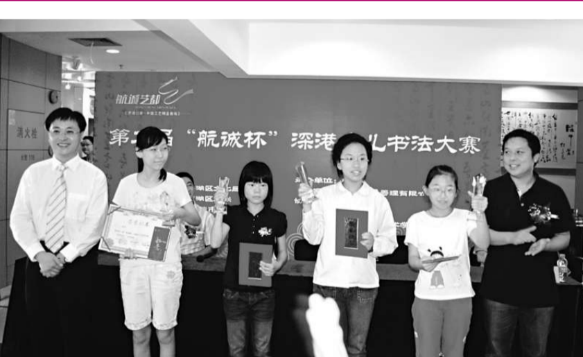
▲第二屆「航誠杯」深港少兒書法大賽頒獎嘉賓與得獎者合影

繼去年首屆「航誠杯」深港少兒書法大賽成功舉辦後，由深圳市航誠投資管理有限公司聯合深圳市羅湖區文化局、羅湖區文聯等相關單位舉辦的第二屆「航誠杯」深港少兒書法大賽活動於日前(8月17日)在航誠藝都中國工藝精品商場圓滿落幕。 據悉，此次比賽是一個旨在弘揚中華傳統文化的公益性活動，歷時一個月。大賽分為兒童組和少年組，初賽選手達300餘人，經過評審專家委員會的公正評審，共評出80位選手進入決賽。一批優秀書法作品的作者分別榮獲一等獎、二等獎、三等獎和優秀獎。 此次活動以「慶奧運、慶深圳改革30周年變化和暢想未來」為主題，意在使深港兩地的青少年對我國改革開放三十年來的偉大巨變有一個全面的認識，同時為奧運健兒加油助威，促進深港兩地少兒在中華傳統文化和愛國主義情懷等方面的深入交流。 尤值一提的是，主辦方還專門邀請內地知名書法家做大賽評委，親臨現場為參賽選手做書法技能指導，幫助參賽選手們在書法技藝上更上一層樓。通過書法比賽，讓深港兩地愛好書法的小朋友齊集一堂、激墨揮毫，在展示個人風采的同時，又提升了書法技藝。