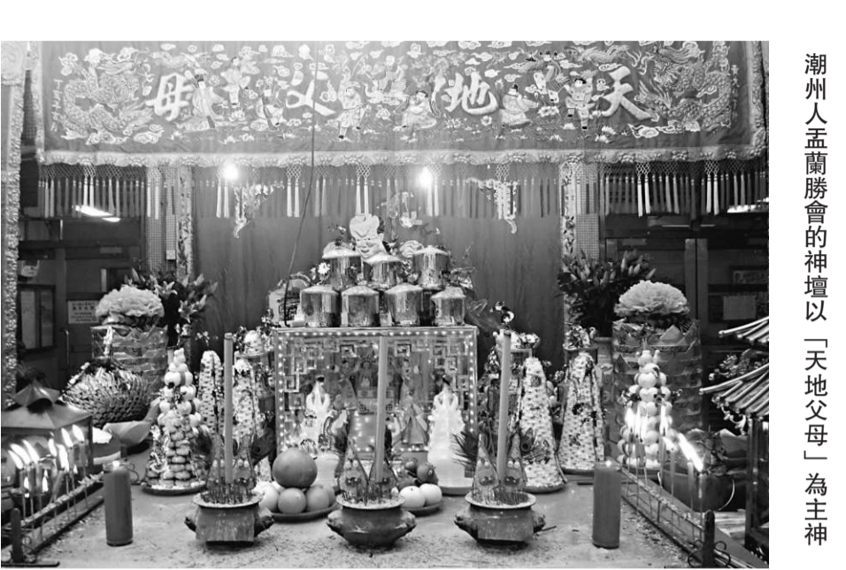
潮州人孟蘭勝會的神壇以「天地父母」為主神

有說孟蘭勝會是由潮州人帶來香港的，而現今在香港各地舉辦的孟蘭勝會約有六十多處，以潮州人辦的佔最多。會場內通常都搭了神棚、神袍棚、經棚、大士棚、幽棚和戲棚，而潮州人供奉的主要神靈一定是「天地父母」，這個不以形象示人的神靈只用香爐為代表。 什麼是「天地父母」？照字面解釋，分別是指天、地、父和母。在潮州人心中，萬事萬物都是「天地父母」化育而成，其中「天」與民間信仰的玉皇大帝連繫起來，把正月初九定為天公聖誕。至於土地，則像母親哺育嬰兒一樣，給人類帶來食物和生命所需，他們稱之為「地母」。在民間，父母對個人而言亦很重要，故此拜祭時把「天地父母」一起供奉，以表達感恩之心。 這四位一體的神靈，難以用神像展現出來。在潮州人善信較多的廟宇內，可見有一面寫上「天地父母」四字的牌位，前面放置香爐。每到孟蘭勝會，潮州人便將香爐移放到會場的神壇，給坊眾上香供奉。 在「天地父母」香爐兩旁，通常是一「南辰北斗」和「諸位福神」的香爐，有時候也會見到地區上其他神靈，但一律都是香爐，不會擺放神像。鶴佬人辦的孟蘭勝會也供奉「天地父母」，但不一定作為主要神靈。他們會奉祀其他神像，畢竟孟蘭勝會是一個迎接眾神到來參與的盛會。