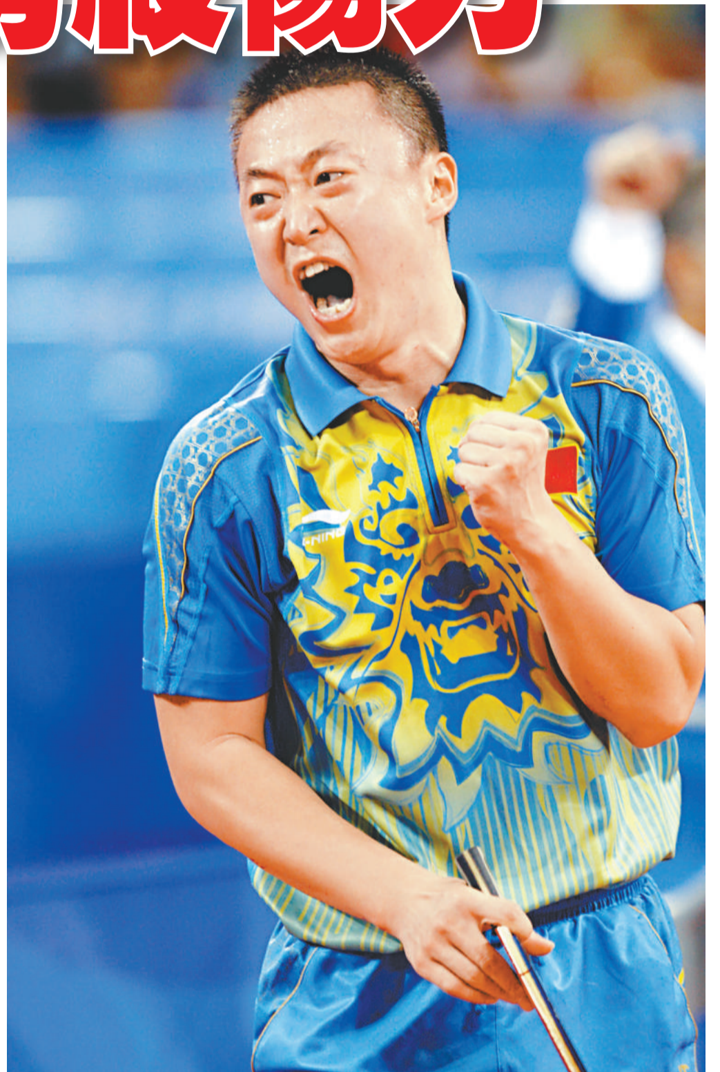
▲馬琳是世界上第一個也是唯一一個獲得4屆世界杯冠軍的選手