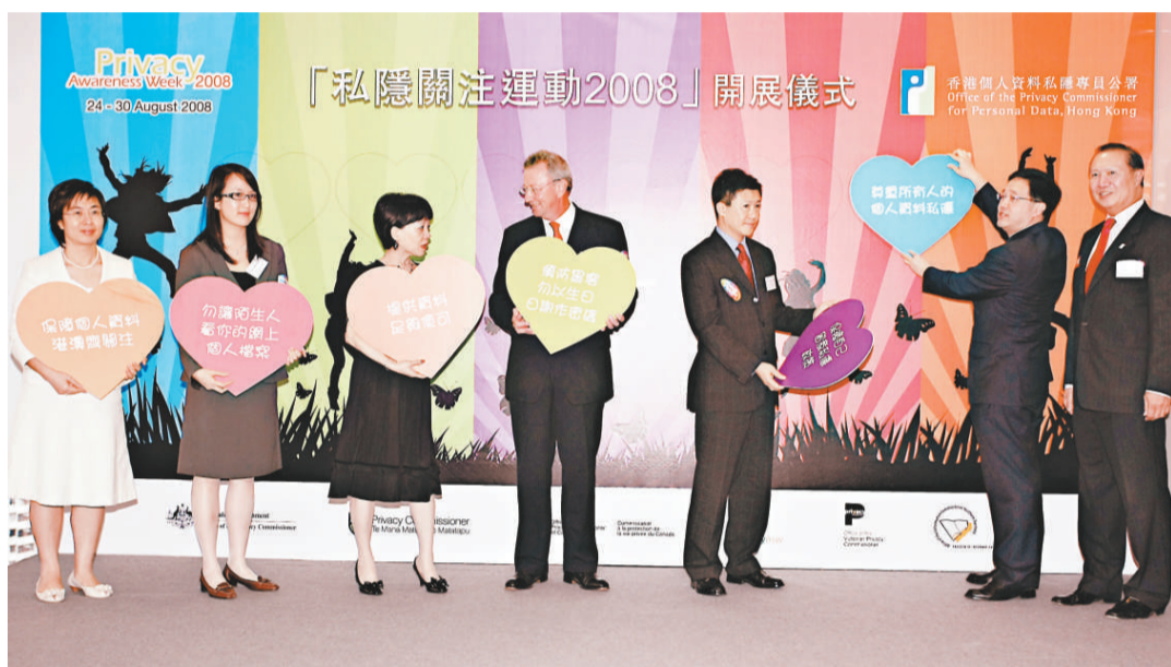
私隱關注運動今年的主題是「論私隱，你有份」

吳斌就表示，希望政府加強私隱保障宣傳，港府可參考英國等國家，將故意洩漏私隱資料行為刑事化，但他強調，只是針對違反保障個人資料私隱條例內原則的行為，而非「一刀切」做法。