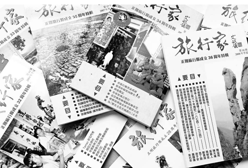
每年出版一期的《旅行家》叢刊

新期的《旅行家》中，有關香港的內容包括講述遷徙了的全真道「南宗」鑪峰學院、濟公佛的信仰、施琅後人與香港鎮海宮、東華三院六十年報章摘錄、屏山鄧族文物館的由來、打鼓嶺禁區，以及概述香港節慶風俗等文章。