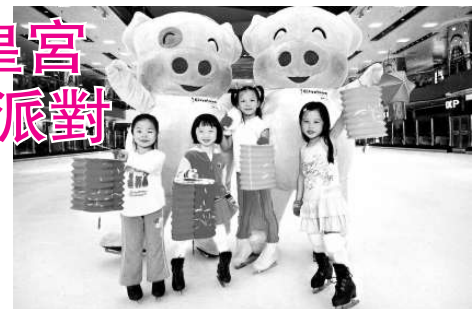
太古城中心冰上皇宮「中秋節溜冰派對」

期間，凡於星期一至五購買兩張太古城中心冰上皇宮入場券，即可額外獲得免費入場一次，並同時獲贈半價優惠券以購買「中秋節溜冰派對」入場券。查詢熱線：28448688。