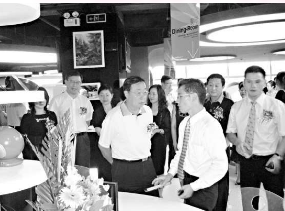
深圳市政府黨組副書記劉應力(左四)參觀三諾產品展廳

日前，深圳市三諾數碼集團有限公司在韓國上市一周年暨公司成立十二周年暨總部喬遷入駐深圳南山區科技園軟件園的答謝酒會在科技園軟件園進行。深圳市政府黨組副書記劉應力等相關領導及近20家媒體出席了酒會。