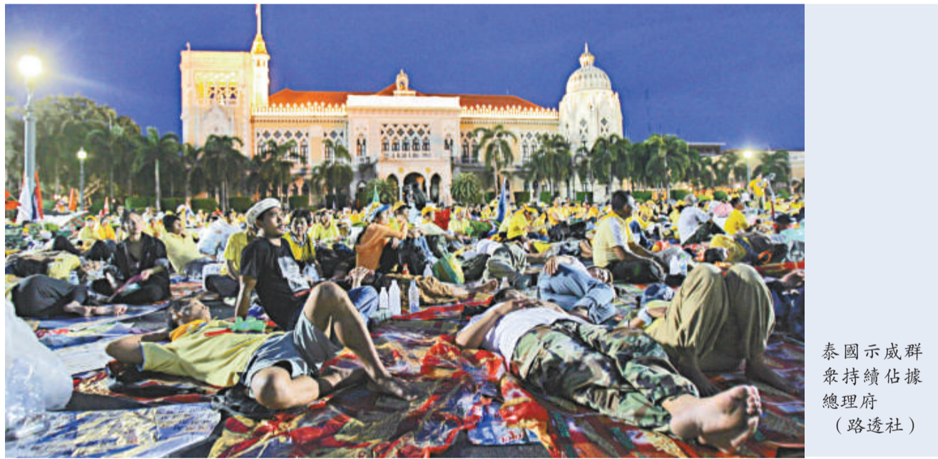
泰國示威群眾持續佔據總理府 (路透社)

民盟在二十六日發動大型示威，要求總理沙馬下台。抗議群眾兵分多路圍攻財政部、都會警察總部等政府機構，並佔領國家電視台，最後闖入總理府院區，癱瘓政府機構運作，結果引發民眾普遍不滿，認為反對派將失去民眾支持。政局動盪造成泰國股市三個月來下挫近兩成四。