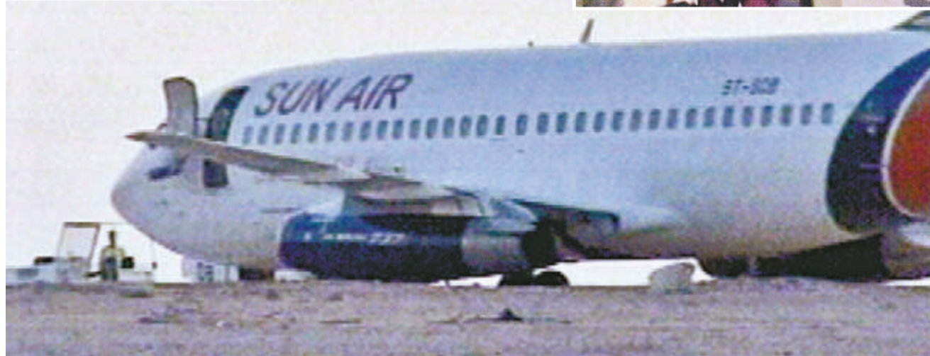
被劫持的蘇丹客機降落在利比亞東南部的庫夫拉機場

【本報訊】據新華社的黎波里二十七日消息：一架被劫持的蘇丹客機二十六日晚降落在利比亞東南部的庫夫拉機場，兩名劫機者在與利比亞官員談判後投降。