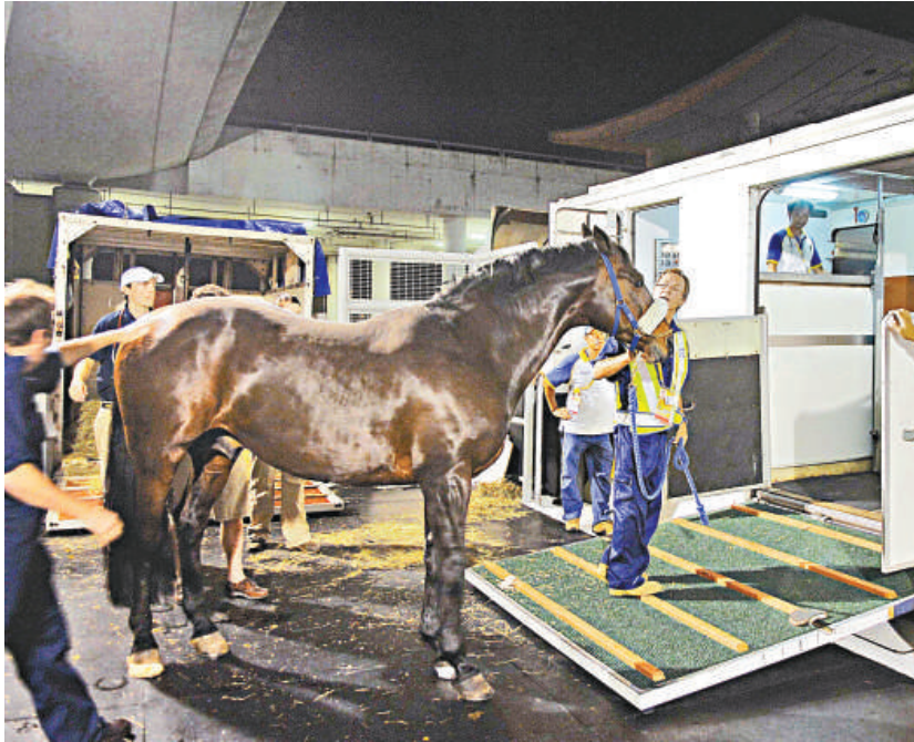
首批來港參加殘奧馬術項目的馬匹於前晚抵達香港國際機場

【本報訊】記者賀晨報道：零八殘奧馬術比賽將於九月七日至十一日在香港沙田賽馬場舉行，比賽門票將於本周五開始通過中旅社發售，每張售價為港幣三十九元，另外第一批的海外參賽馬匹已於前晚安全飛抵香港。