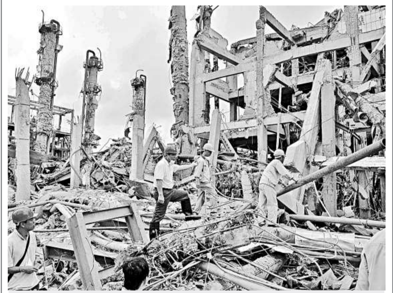
廣西化工廠爆炸事故死亡人數增至20人。圖為當地幹部和公司人員在勘察現場