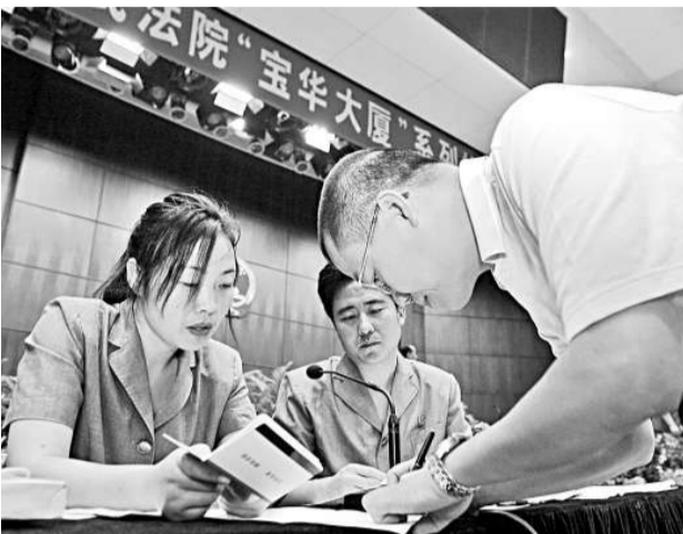
廣州「棚尾樓」寶華大廈系列執行案歷時數年終結，包括20多戶香港小業主在內的71名債權人終於拿到追討多年的欠款。圖為發放欠款現場。