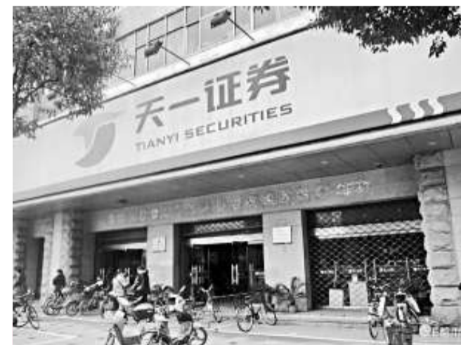
寧波天一證券涉嫌非法吸收公眾存款38億元，五名高管被起訴（網絡圖片）

公安機關對天一證券事件立案，今年2月28日，案件移送至檢察院審查起訴。檢方認定天一證券有限責任公司未經中國人民銀行批准，在明知不具有吸收公眾存款資格的情況下，以開展委託理財和三方監管業務為名，採取保本付息的方式向社會不特定單位和個人吸收資金逾38億元，嚴重擾亂了國家金融秩序。五名原公司高管屬單位實施非法吸收公眾存款罪中直接負責人，應當以非法吸收公眾存款罪追究其刑事責任。