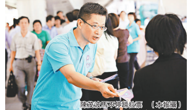
陳茂波馬不停蹄拉票