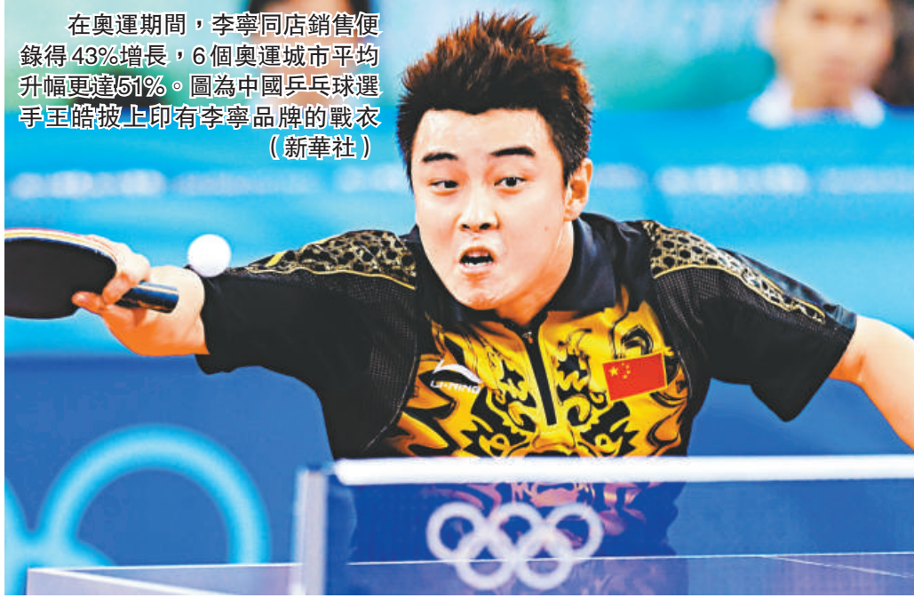
在奧運期間，李寧同店銷售便錄得43%增長，6個奧運城市平均升幅更達51%。圖為中國乒乓球選手王皓披上印有李寧品牌的戰衣