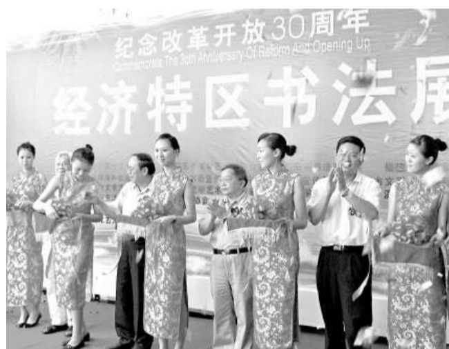
「紀念改革開放30周年——經濟特區書法聯展」首展二十九日在珠海古元美術館開展，吸引了不少市民前去參觀。此次共展出了一百八十七件書法作品，書法展在珠海首展後，還將陸續赴深圳、汕頭、廈門等地巡展 (中通社)

有內地網友表示：美麗的iPhone就產生在這樣美麗的中國打工妹手中，她是這世界工廠工業鏈條上的一分子。雖然她是iPhone生產線上的一環，她可能非常喜歡iPhone，但是她卻不能擁有一部這樣的手機……筆者認為，「中國製造」如果不能在這一波的調整、轉型中完成圍與涅槃，成長為「中國創造」。那麼「iPhone girl」還會只能把自己的笑容留在別人的手機裡。也許，她還很可能會失去這樣的機會。君不見，這一年來，東莞、深圳已經有多少家企業熬不過這一波不景氣的行情，相繼關門倒閉。