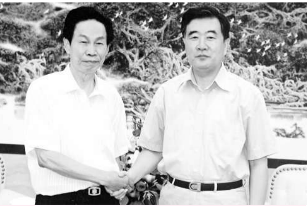
廣東省委書記汪洋（右）和世界華僑華人社團聯合總會副會長胡國贊（左）親切握手

【本報訊】廣東省委書記汪洋本月21日上午會見金龍科技集團董事長、中華海外聯誼會理事、原山東省第九屆委員會常委、世界胡氏宗親聯合會會長、世界華僑華人社團聯合總會副會長胡國贊和台商潘君威先生一行，對胡國贊先生長期以來為祖國的投資、引資所做的很多貢獻，給予高度評價並表示感謝，並代表廣東省委歡迎各位客人來投資。