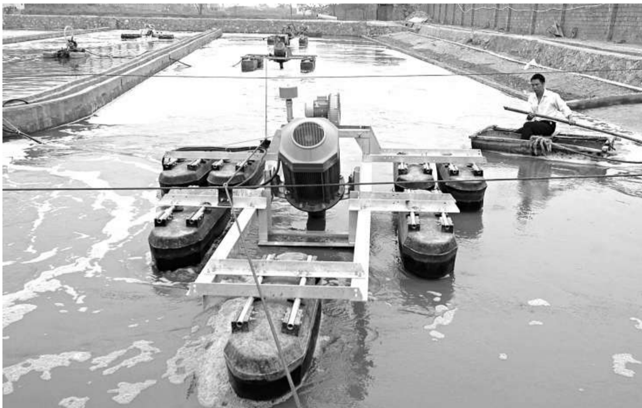
為減少污水對環境的影響，廣東將強制要求珠三角中心鎮全部興建污水處理廠 (資料圖片)

三要加大環境監管執法力度。對污染減排的重點地區和重點污染企業實行掛牌督辦，對享受脫硫電價政策但脫硫設備不按规定運行的，依法嚴肅查處。在今年年底和2010年底前建成污染源在線監控系統並聯網，確保可監控國家控制重點污染源和廣東省控制重點污染源排放。四是加快減排技術創新。五要實行積極的經濟政策促進污染減排，研究建立主要污染物排放指標有償使用制度。