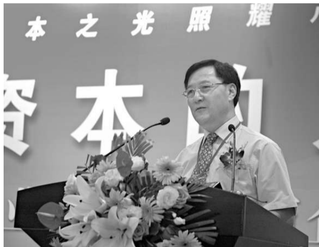
被譽為中國風險投資先驅的張景安教授縱論金融創新之策

近年來，佛山市已出台多項金融業發展戰略決策，提出推動創業風險投資行業發展，加快企業上市、打造資本市場佛山板塊等金融創新舉措，佛山期望借助廣東金融高新技術服務區落戶佛山為契機，把佛山建設成一個金融產業發展的重要基地，即成為粵港澳區域金融合作的創新試點基地和重要的金融後台業務及外包業務基地。