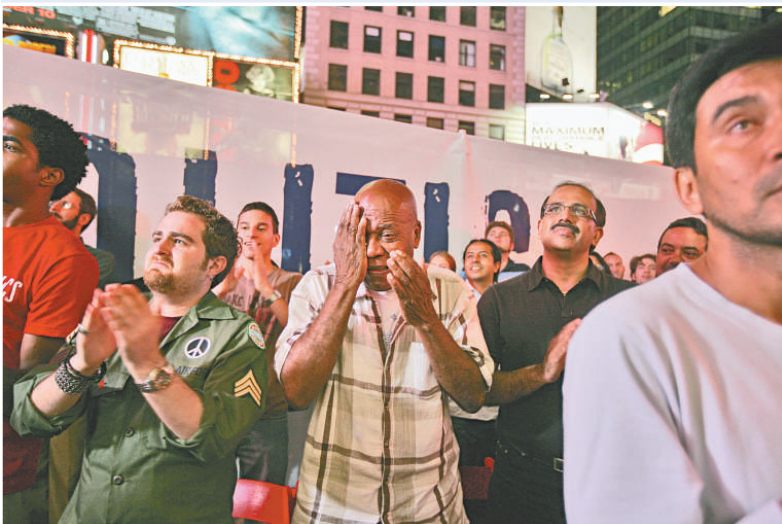
▼會場內的民主黨支持者激動地流下熱淚