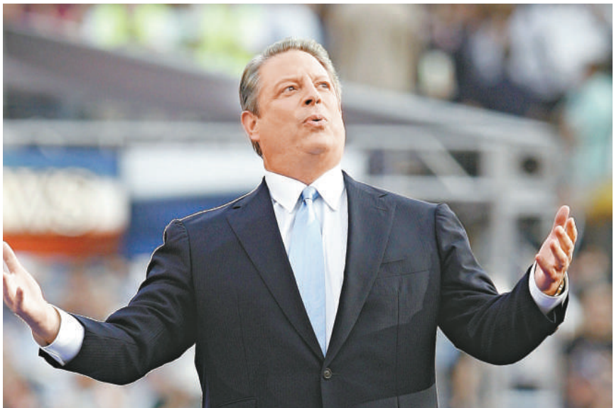
▲戈爾說奧巴馬是領導美國邁入非凡新時代的不二人選

這位前美國副總統在全代會最後一天的演說中火力全開，表示如果他擊敗布什而贏得二〇〇〇年爭議性的總統大選，美國現時將截然不同。