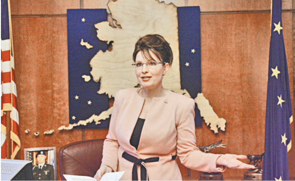
▲佩林是五個孩子的母親，也是一名積極的反墮胎人士