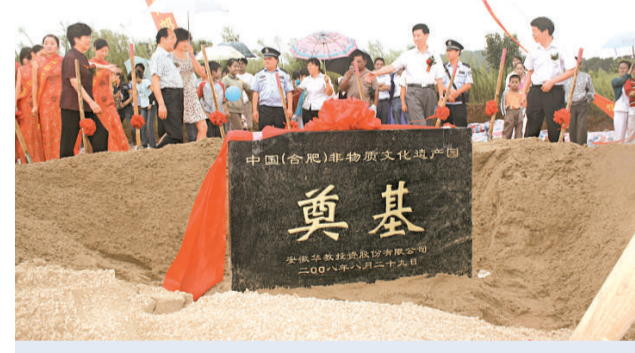
中國(合肥)非物質文化遺產園奠基

強，經濟和社會的急劇變遷，以口傳心授傳承的非物質文化形式陷入重重困境，主要表現為傳承人急劇減少、生存空間不斷縮小和語境萎縮。非遺產園項目的推出，正是為了破解中國非物質文化遺產的發展困局。