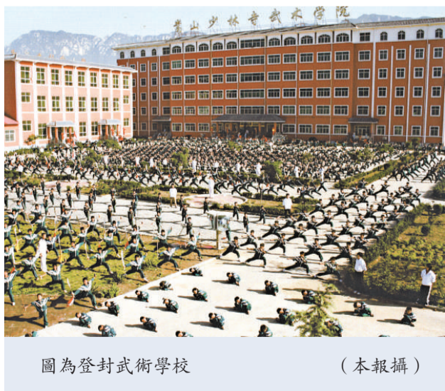
圖為登封武術學校

目前，登封市武術館校已發展到83所，常年在校學生5萬多人。今年，武術團培訓基地、小龍武院、塔溝武校又投資6000萬元擴建校舍，改善教學、訓練、工作、生活環境。目前登封市武術基礎設施面積已達200萬平方米，建築面積已達60萬平方米。