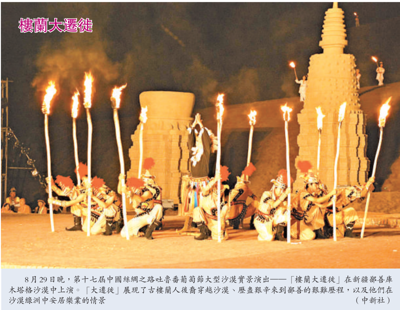
8月29日晚，第十七屆中國絲綢之路吐魯番葡萄節大型沙漠實景演出——「樓蘭大遷徙」在新疆鄯善庫木塔格沙漠中上演。「大遷徙」展現了古樓蘭人後裔穿越沙漠、歷盡艱辛來到鄯善的艱難歷程，以及他們在沙漠綠洲中安居樂業的情景