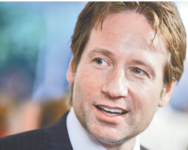
▲大衛杜楚尼沉溺性愛成癮

一九六〇年生於紐約的大衛杜楚尼，從普林斯頓大學取得學士學位之後，又在耶魯大學取得英國文學碩士，是荷里活少數擁有長春藤名校學歷的影星。他在九十年代的熱門電視劇集《X 檔案》紅，曾獲一九九六年金球獎電視劇集類最佳男主角，後來轉戰大銀幕演出《地球再發育》等片。