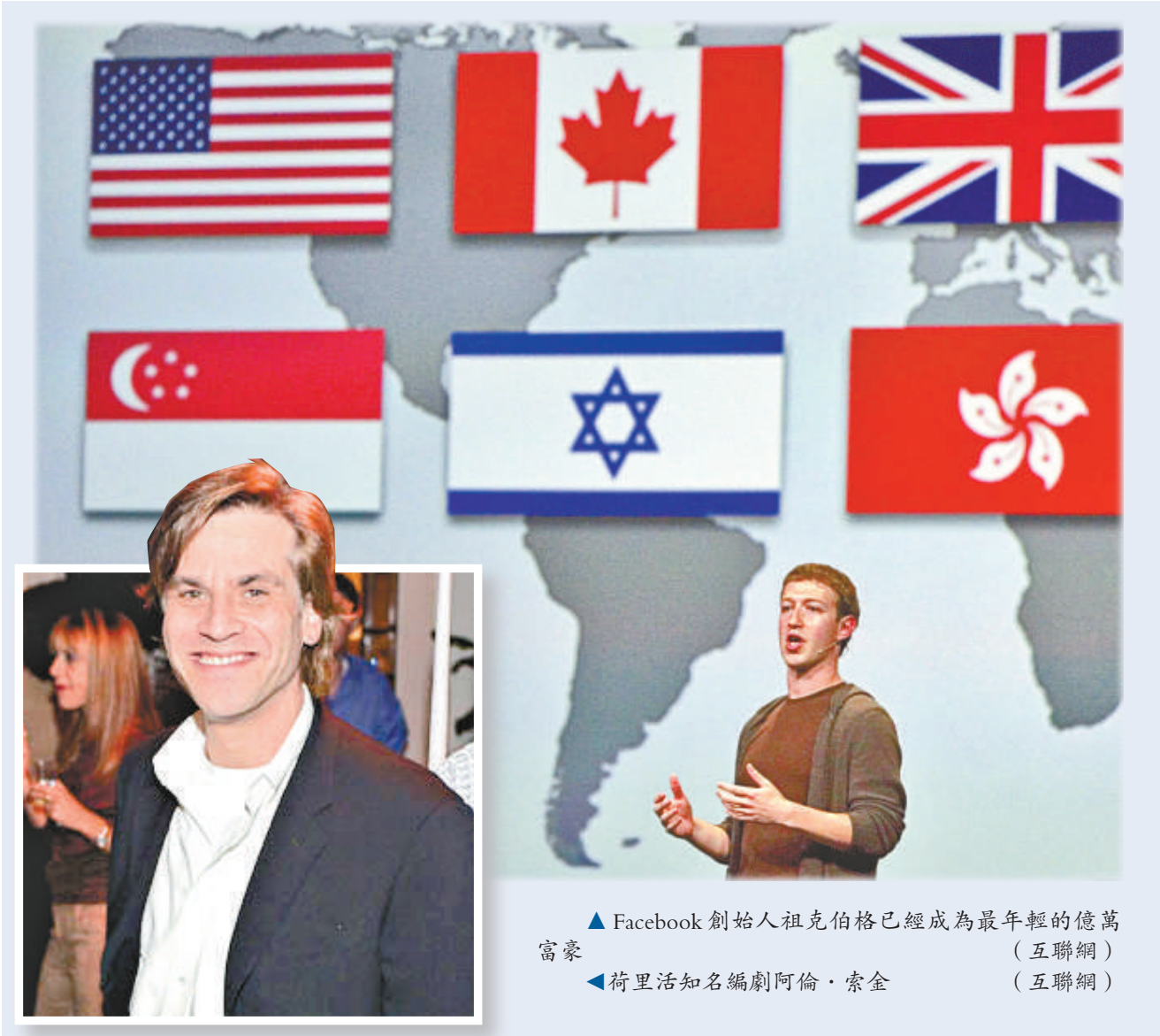
▲ Facebook 創始人祖克伯格已經成為最年輕的億萬富豪（互聯網） ▲ 荷里活知名編劇阿倫·索金（互聯網）

祖克伯格拒絕了十位數字的收購建議，但他把 Facebook 百分之一點六的股份以二億四千萬美元賣給電腦軟件巨擘微軟公司。