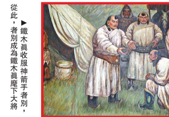
▲鐵木真收服神箭手者別，從此，者別成為鐵木真麾下大將