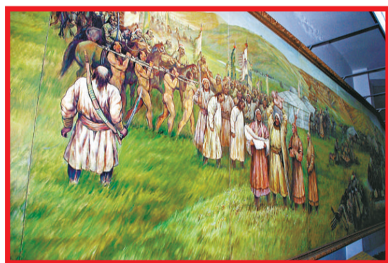
▲《蒙古歷史長卷》局部「天驕降生」 ▶12世紀80年代鐵木真稱汗，從此，「成吉思汗」名號在草原上廣為人知