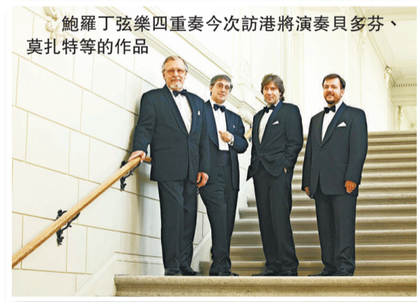
鮑羅丁弦樂四重奏今次訪港將演奏貝多芬、莫扎特等的作品

八月下旬，鮑羅丁四重奏完成馬來西亞吉隆坡幾場音樂會後，將於九月初來港表演一場。從主辦機構康樂及文化事務署隨附的宣傳單張，可以推想，這場在港演出的音樂會，很可能是近日最後定，以致來不及設計一張較為完整實價的宣傳單張。