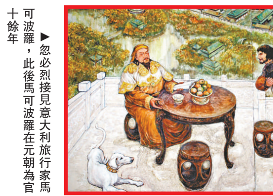
可波羅，此後馬可波羅在元朝為官十餘年

成吉思汗旅遊文化周日前舉行，開幕式當天舉行了成吉思汗祭祀活動，盛大的蒙古族歌舞表演，讓成吉思汗陵沉浸在一片歡樂祥和的氣氛中。隨後，組委會邀請記者參觀了成吉思汗陵蒙古歷史文化博物館，館中206米的《蒙古歷史長卷》是迄今為止世界上最長的史詩性油畫作品，再現了從成吉思汗誕生到元王朝建立的206年裡的重重大歷史史實。而該油畫的創作過程也是繪畫藝術史上的一次重要探索。