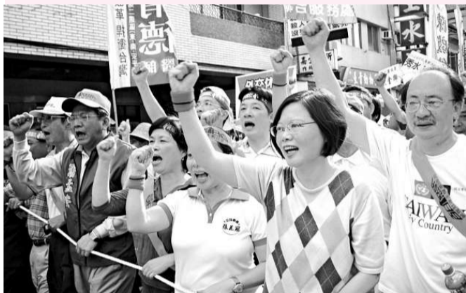
▲蔡英文(右二)帶領民眾走上街頭嗆馬