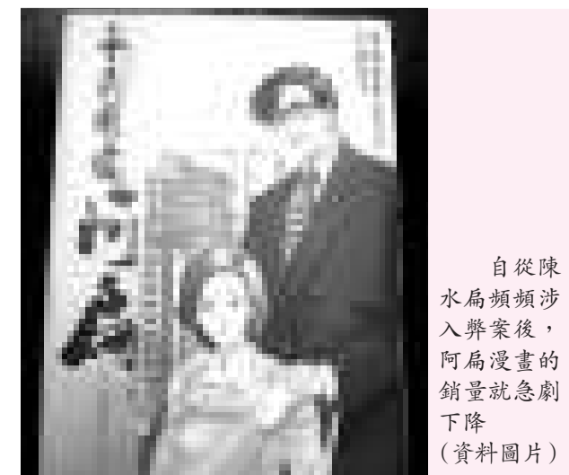
自從陳水扁頻頻涉入弊案後，阿扁漫畫的銷量就急劇下降(資料圖片)

出版業者「尖端出版」很低調，僅表示書已絕版，不會再碰政治人物題材。業界人士私下表示，一般漫畫迷對政治人物漫畫很反感，頂多拿來惡搞，阿扁漫畫起初多為支持者相挺購買，但藍綠陣營其實都不關心漫畫產業，後續幾集銷量不佳，海外版權也未賣出，今昔對比書中內容，還真有些尷尬。