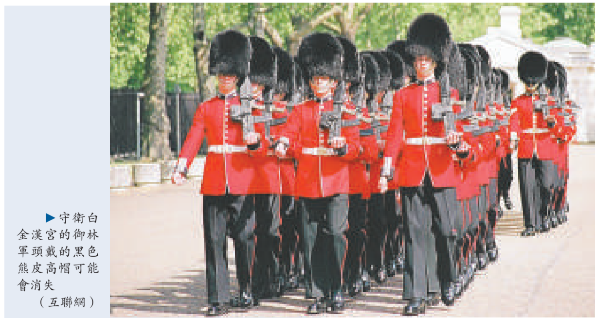
▶守衛白金漢宮的御林軍頭戴的黑色熊皮高帽可能會消失

談及御林軍的熊皮高帽時，國防部發言人說：「國防部不反對用合成物料來替代熊皮，只要這些物料是可以適應各種氣候的高質素產品。」