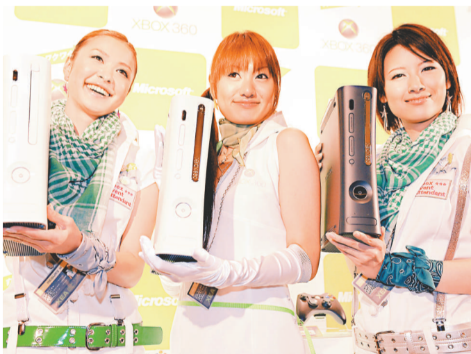
▲日本市場銷售的 Xbox 360 遊戲機將降價三成

目前無法找到微軟日本公司代表就上述報導發表評論。經調價後，新價格將使得 Xbox 360 遊戲機比任天堂 Wii 更便宜，Wii 目前售價為二點五萬日圓，索尼 PS3 售價是三萬九千八百日圓。