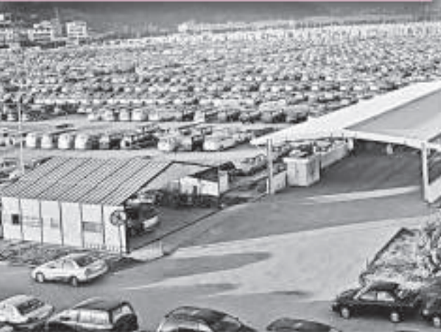
▲福州東南汽車城一角，展示了現代化的汽車生產基地。

凌玉章介紹，一九九五年，福建省汽車工業集團公司與台灣最大的汽車企業裕隆集團所屬中華汽車公司，攜手組建了東南汽車公司，閩台雙方精誠合作，為福建省汽車工業的發展騰飛拉開了序幕。二〇〇六年四月十二日，日本三菱汽車公司正式入股東南汽車，宣告東南汽車從閩台合作走向國際合作。東南汽車以醞釀了十年的實力，抓住機遇，邁出了東南自主品牌與三菱國際品牌雙品牌合作的第一步。當年五月，聯手推出首款中級轎車三菱藍瑟。