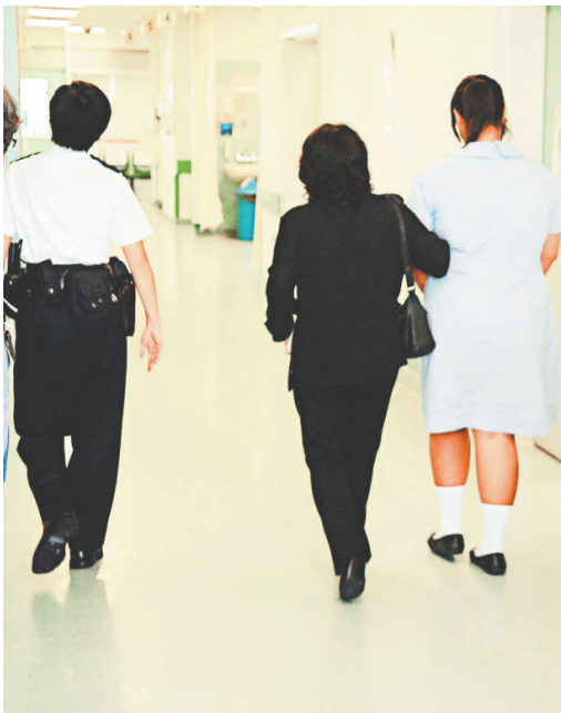
▲死者女兒（穿校服者）由親友陪同到醫院 ▼遇溺婦人證實不治，屍體昇走