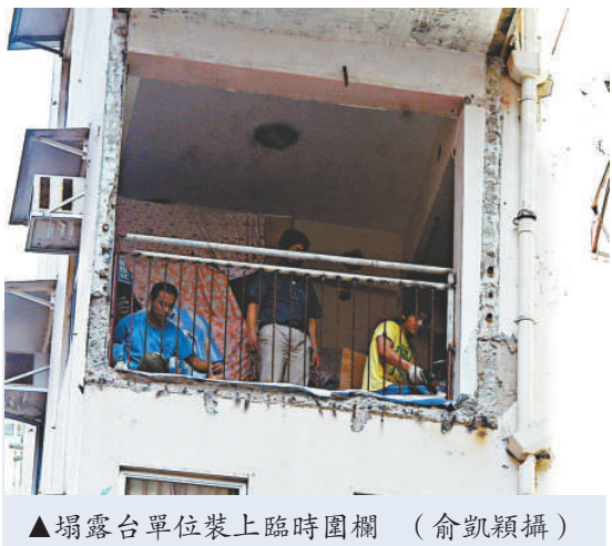
▲塌露台單位裝上臨時圍欄