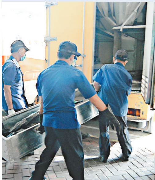
▲死者女兒（穿校服者）由親友陪同到醫院 ▼遇溺婦人證實不治，屍體昇走