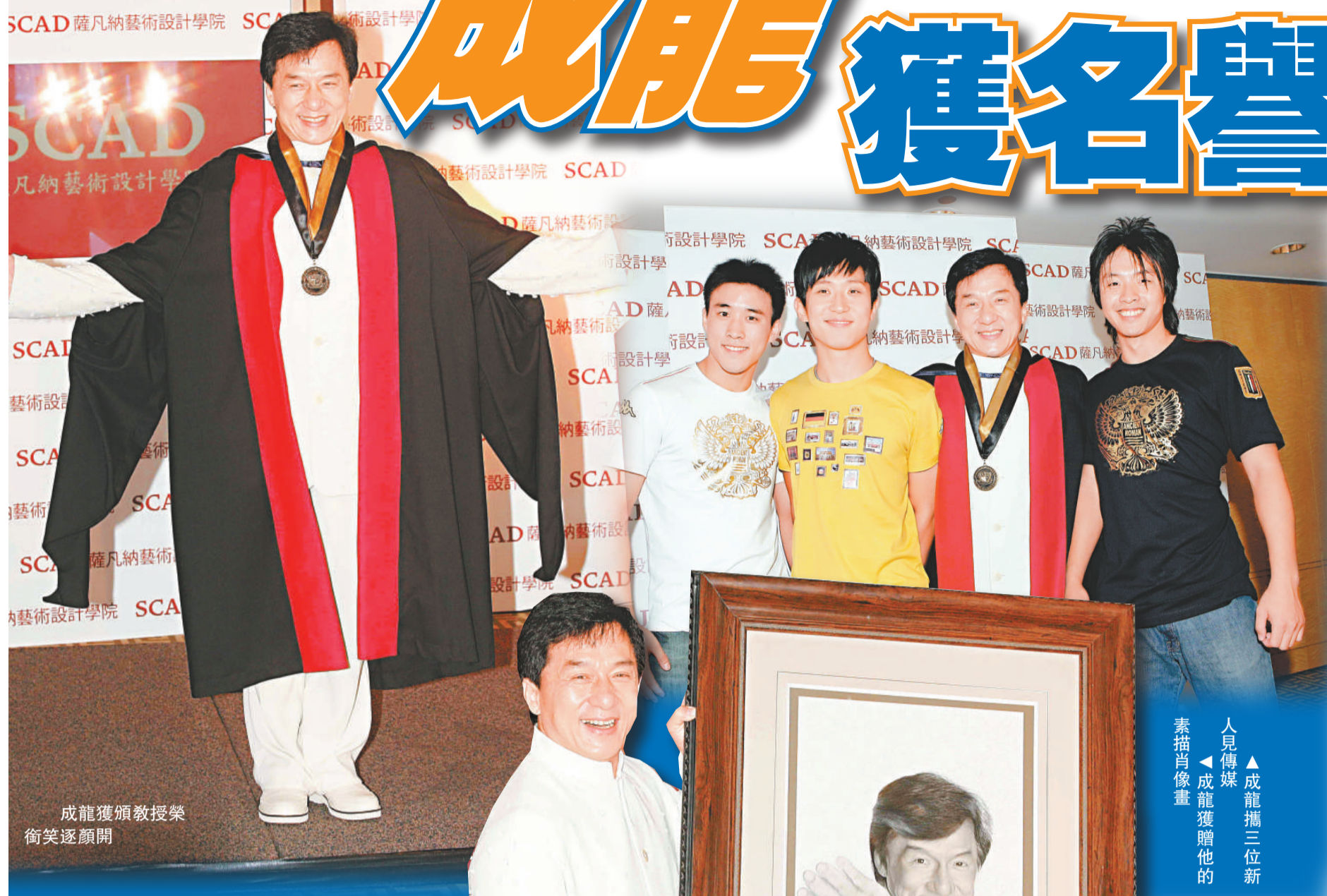
成龍獲頒授榮譽銜笑逐顏開