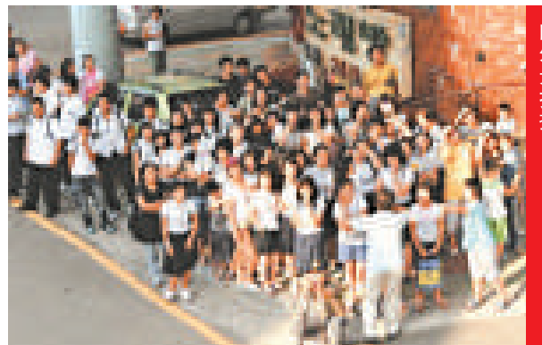
力拍劇 ◀ 釜山民眾觀看《老千》的外景拍攝