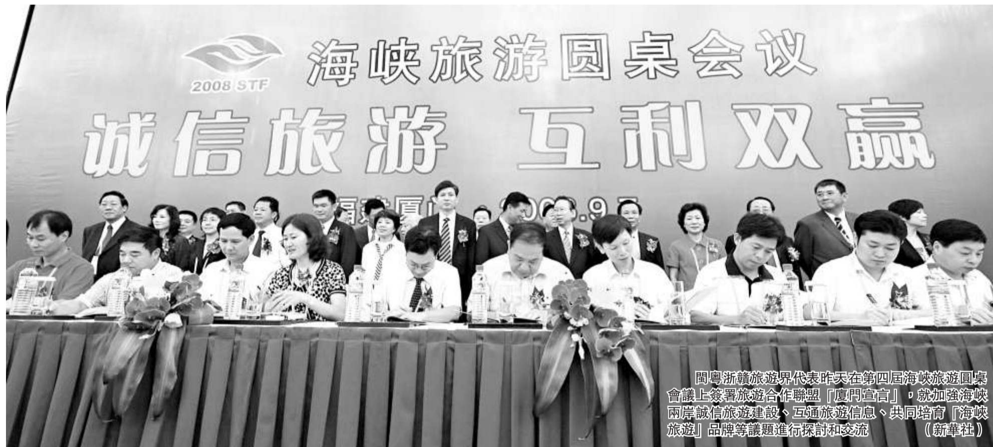
閩粵浙旅遊界代表昨天在第四屆海峽旅遊圓桌會議上簽署旅遊合作聯盟「廈門宣言」，就加強海峽兩岸誠信旅遊建設、互通旅遊信息、共同培育「海峽旅遊」品牌等議題進行探討和交流

座談會上，七位分別來自知識界、企業界、醫學界、法律界等領域的中青年台胞代表發言，結合自身經歷談了改革開放30年來的感受。台胞們表示，改革開放政策為台胞的發展提供了良好機遇，無論國家還是個人都從改革開放政策中受益良多。