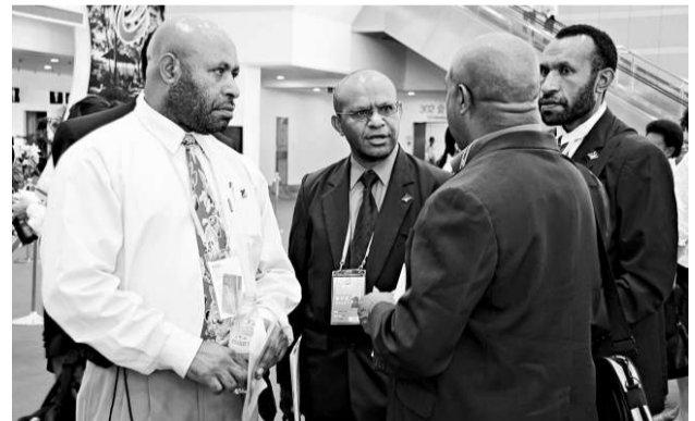
來自11個太平洋島國的政府官員和國際組織成員昨天在廈門出席了「中國與太平洋島國經濟發展合作論壇」，並互相交流