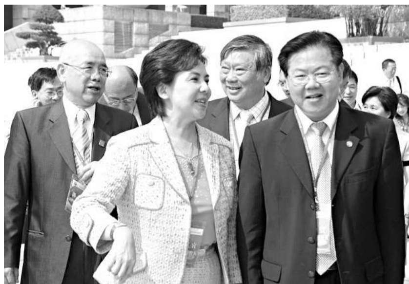
第二屆海峽兩岸大專院校論壇昨天在廈門落下帷幕。圖為漢江大學校長張家宜（前左）與廈門大學校長朱崇實（右）步出會場

(四) 積極探索與交流創建世界一流大學的模式和管道，尋找和平發展主題下兩岸一流大學的共同責任，