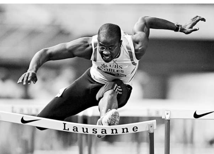
▲古巴小將羅伯斯欄上英姿

【本報訊】據古巴六日消息：在成為北京奧運會冠軍之後，古巴小將羅伯斯繼續着自己的歐洲之旅。按照賽程他參加了兩站在瑞士的比賽，並且在蘇黎世跑出了今年的第六個13秒之內的成績。距離完成一個幾近完美的賽季還有三站比賽，羅伯斯忙裡偷閒更新了他在國際田聯的博客。他感謝中國為大家奉獻了精彩的奧運會。