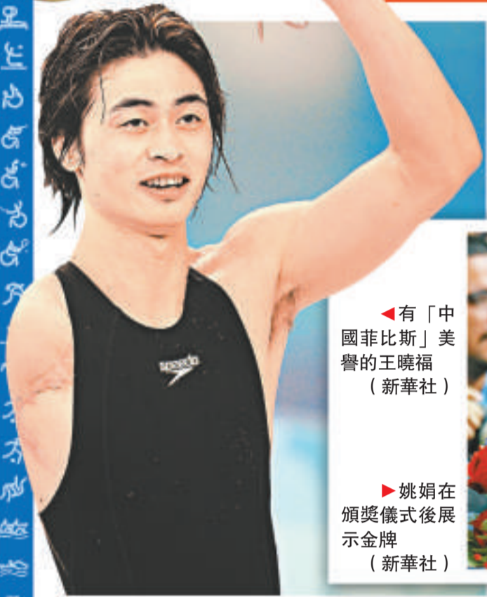
◀有「中國菲比斯」美譽的王曉福