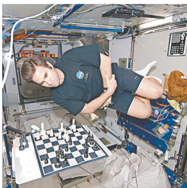
▲太空人恰密杜夫在下西洋棋

恰密杜夫表示棋藝來自家傳，而他整個童年都愛下棋。他預定十一月回地球，NASA 地面指揮中心開玩笑表示，要他小心一點，如果一直贏，可能不會輕易讓他回地球。