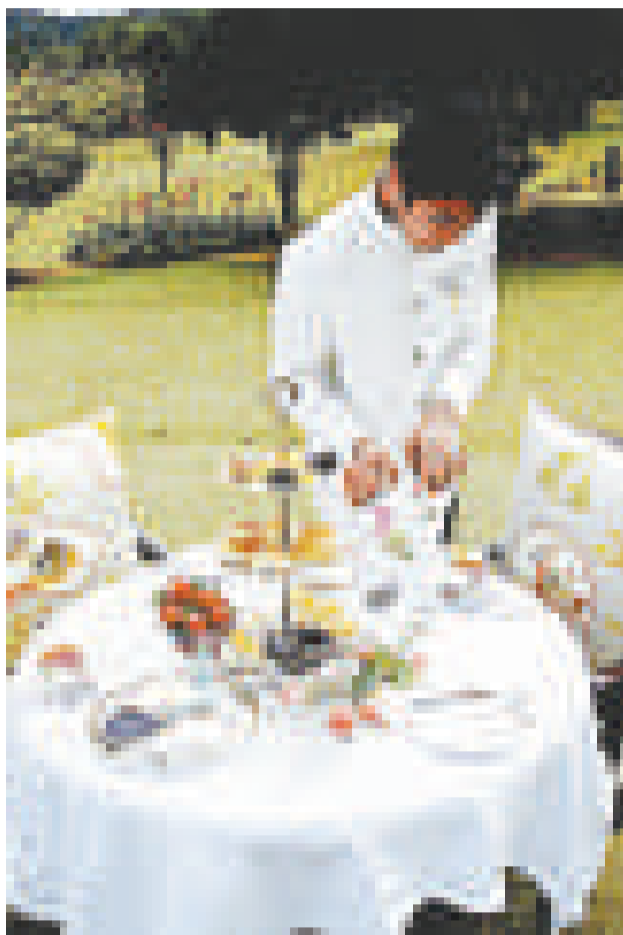
▲隨著世人再次發現茶的魅力，喝茶的儀式似乎有復甦的跡象

【本報訊】綜合美國媒體八日報道：亞洲興起茶葉觀光旅遊熱潮，到馬來西亞、印度或中國參觀茶園並在茶園裡悠閒地品茗，已成為西方人士最熱門的觀光活動。