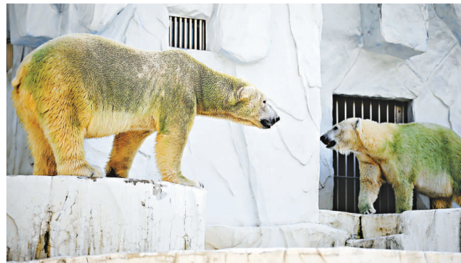
▲被染綠了的北極熊

黑部表示，七月與八月的高溫，加上園方為節約能源而較少換水，導致北極熊戲園內池塘與安全壕溝內的水藻大量增生，而一旦水藻滲入北極熊毛皮內的空隙，就很難清除。他說，戲園內的水藻進入十一月就不再增長，北極熊屆時即可恢復原色。