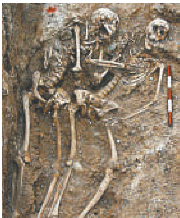
▲考古發現，這對千年手挽手的「夫婦」竟都是男人

「由於沒有任何陪葬物件，我們無法從其他方面找到頭緒。」基金會希望對骸骨進行鑒證可以協助破解謎團。