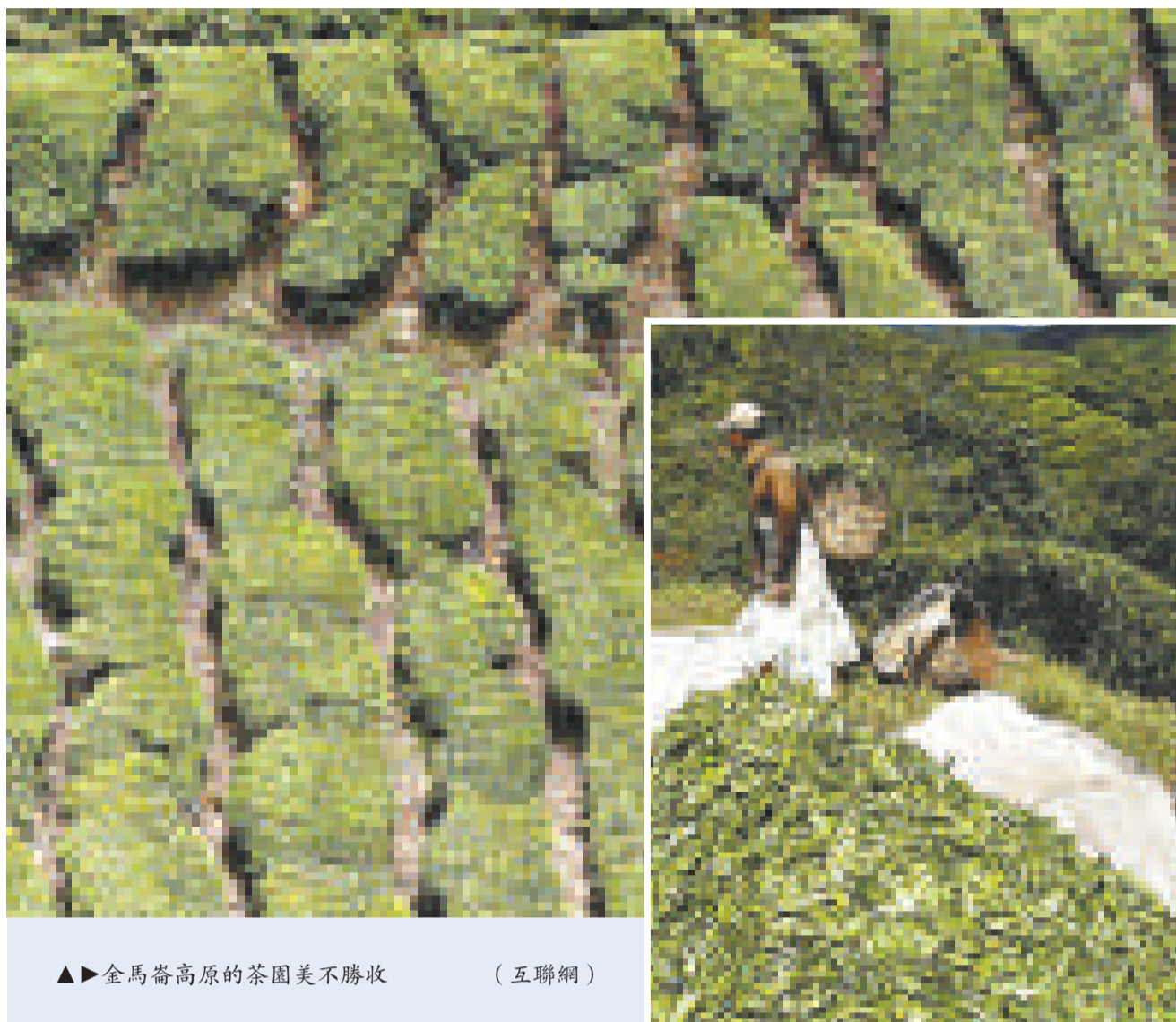
▲金馬崙高原的茶園美不勝收

下午茶過去在印度被視為回到英國殖民統治時代的陋習，但近來愈來愈多的印度人流行喝正統英式下午茶。