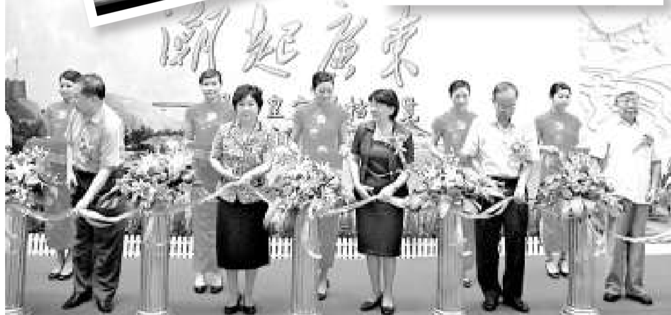
▲有關領導為《潮起廣東》展覽剪綵