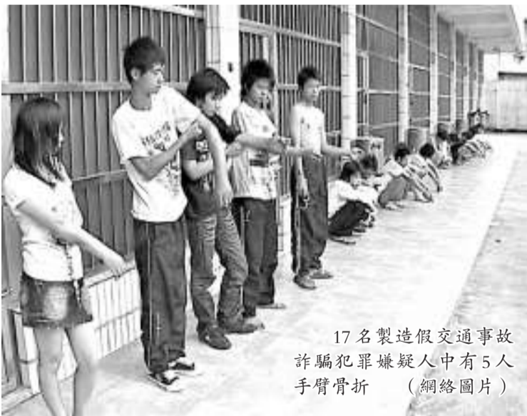
17 名製造假交通事故詐騙犯罪嫌疑入中有 5 人手臂骨折

據當地警方調查，今年以來，東莞部分地區頻頻出現「撞車黨」，手段和方式越來越多樣，東莞警方也先後加大進行偵查整治。其中，東莞市塘廈警員在今年六月底通過幾次突擊偵查，先後抓獲此類犯罪團夥近三十人，其中就有八個「自斷手臂」。