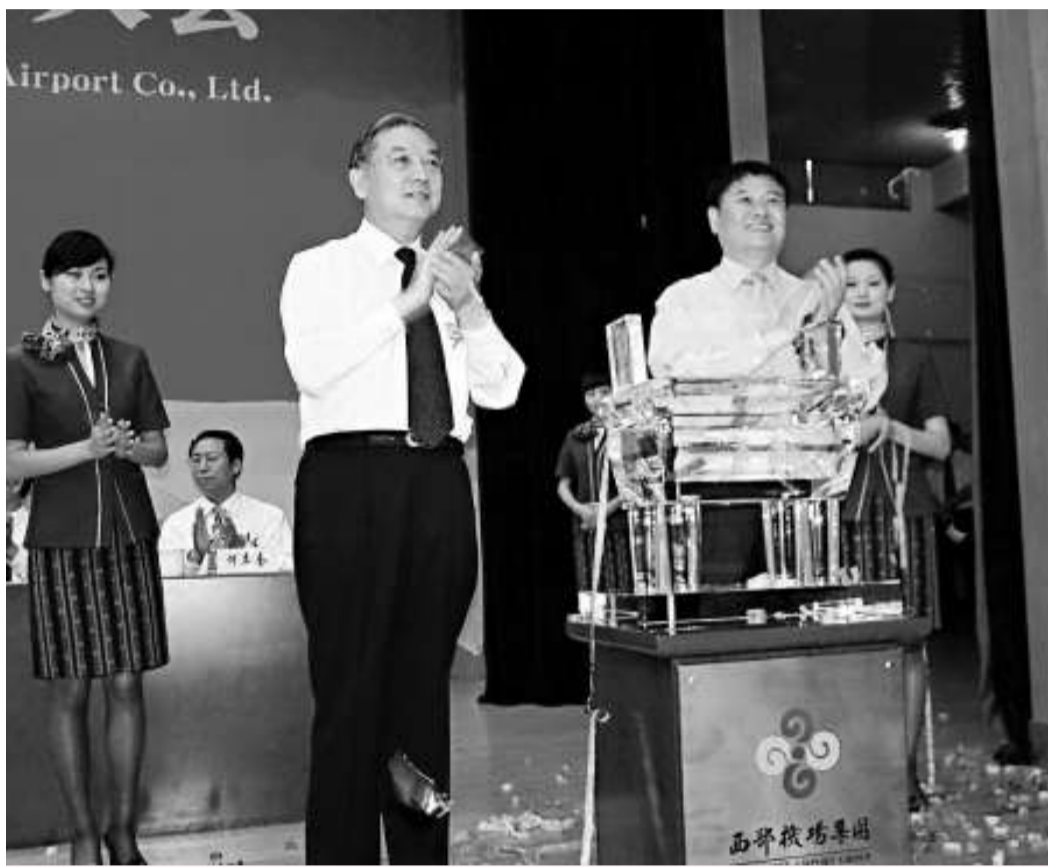
國家民航總局黨組成員嚴志澤（前左）、陝西省副省長洪峰（右）為西部機場集團有限公司和西安咸陽國際機場股份有限公司揭牌

西安咸陽機場股份制改造自2006年啓動，由西部機場集團公司以淨資產出資10.18億元，佔公司總股本的50.9%，法蘭克福機場和中航集團分別以等值於4.9億元人民幣的外幣現金出資，各佔公司總股本的24.5%，西部機場集團航空物流（西安）有限公司以人民幣現金出資200萬元，佔公司總股本的0.1%。