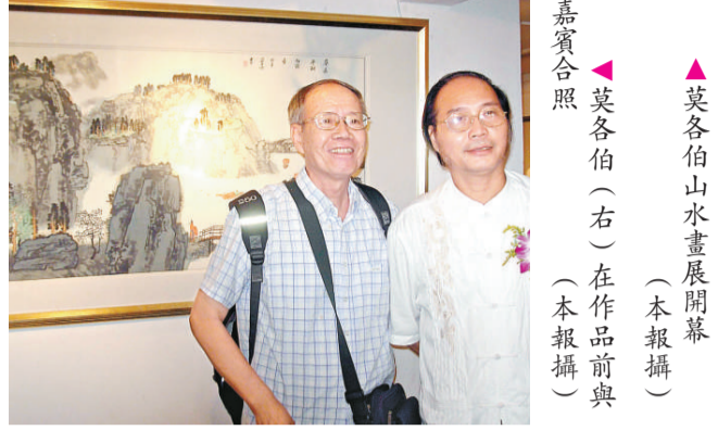
莫各伯山水畫展開幕 莫各伯(右)在作品前與嘉賓合照

【本報記者袁秀賢廣州九日電】著名書畫家莫各伯國畫山水作品展今天上午在太和堂舉行，展出莫各伯山水作品五十多幅，頗受好評。山水畫展至十三日結束。