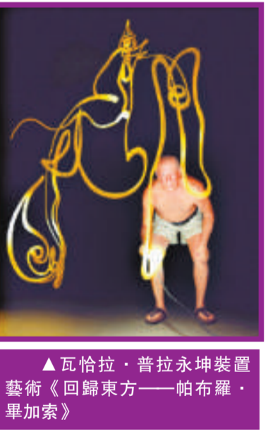
瓦恰拉·普拉永坤裝置藝術《回歸東方——帕布羅·畢加索》

從創作年代上分析，這三幅作品均創作於二〇〇一至二〇〇二年，亦是陳逸飛創作上的黃金時期。