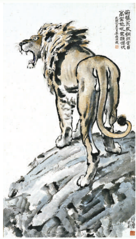
徐悲鴻的《高崗獅吼》，估價二百二十萬至三百萬元