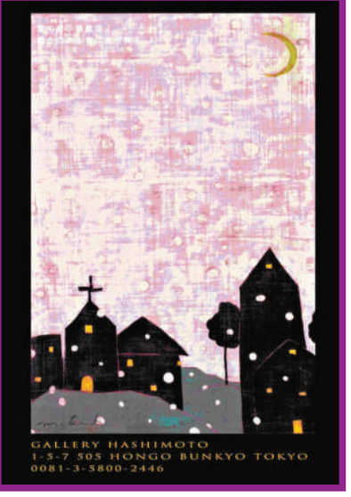
陳佩秋國畫《秋憩》