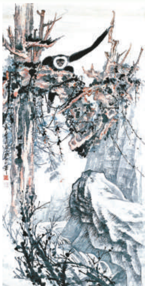
張大千的《老樹騰猿》，估價四百萬至六百萬元

【本報訊】記者鍾麗明報導：吳冠中一幅五米長卷《長江萬里圖》與張大千的一幅八呎巨畫《老樹騰猿》，將於蘇富比秋拍中雙輝映。一直由吳冠中私藏的《長江萬里圖》將首次公開展示，並推出作慈善拍賣，收益捐贈清華大學作獎學金，拍賣行預料成交價可達八百萬港元。