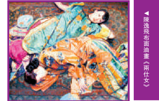
陳逸飛布面油畫《兩仕女》

第十二屆上海藝術博覽會 時間：9月10日至9月14日 地點：上海世貿商城 上海藝術博覽會國際當代藝術展 時間：9月10日至9月13日 地點：上海展覽中心