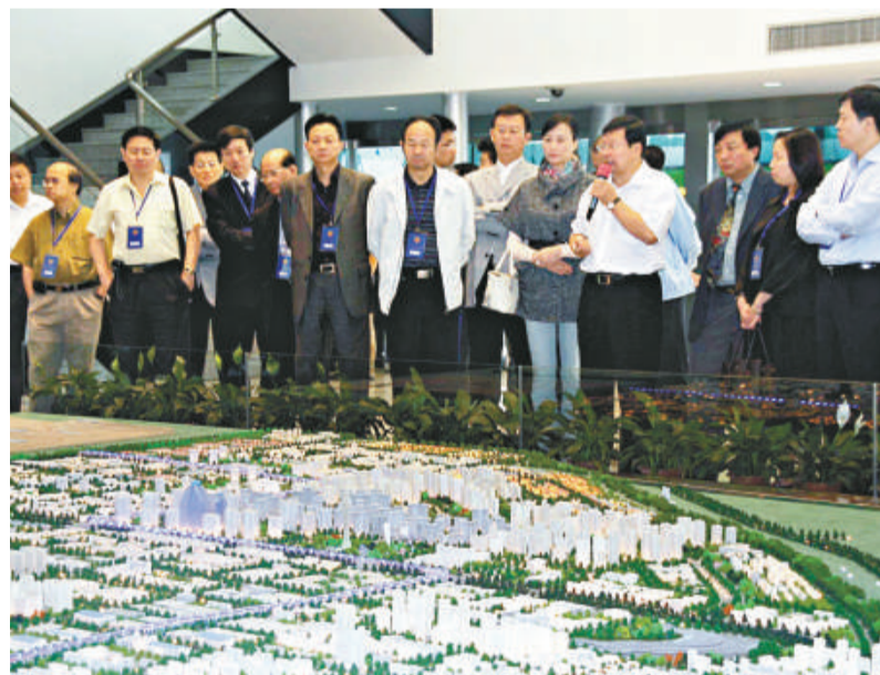
委員們認真聽取航天技術民用化匯報（本報攝）

【本報記者雷永剛、實習記者張瑜西安十日電】「神七」將於月底升空，正在西安視察的陝西省政協港澳委員一行，今天一早特意選擇了視察內地最大的民用航天產業基地。