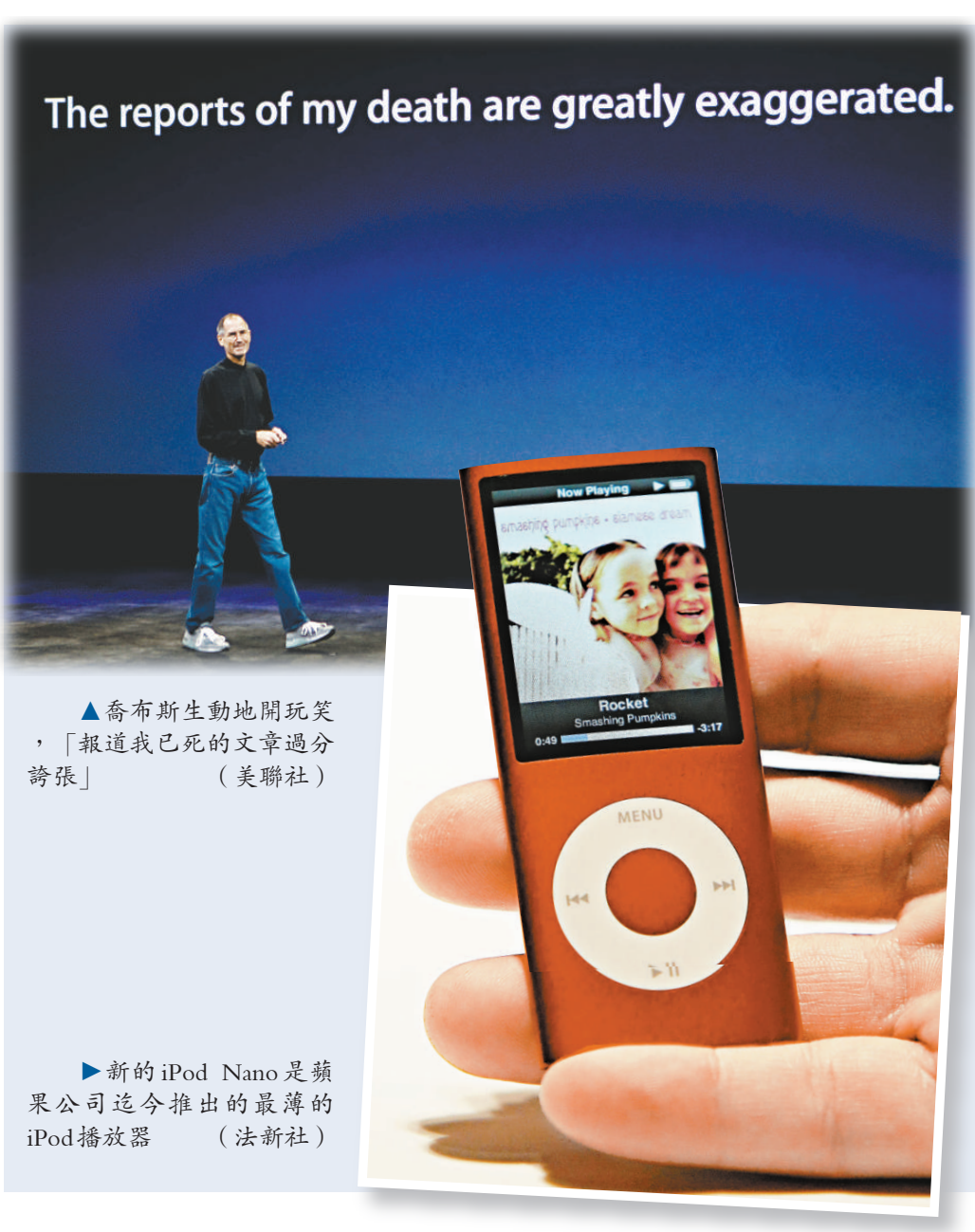
▲喬布斯生動地開玩笑，「報道我已死的文章過分誇張」

二十三。 年終的假期購物旺季一向是蘋果公司最重要的銷售季，喬布斯希望靠 iPod 降價帶動消費者採購蘋果產品的熱潮。由於消費者預算已因汽油、食品價格飛揚而捉襟見肘，推出更便宜的機型，將有助消費者放鬆對荷包的看管。但基金公司分析師曼斯特說，他原本預期蘋果會把 8GB 的機型降到一百九十九美元，與新款的 iPhone 3G 相當。 身形有些瘦削的喬布斯，穿著他招牌的牛仔褲與黑色套領衫亮相。在此之前的三個月中，喬布斯一直被籠罩在癌症復發的猜測之中（他曾在二〇〇四年成功進行了癌症手術），儘管自己親自找到《紐約時報》記者闢謠，但仍然無法阻止流言的擴散，著名的彭博社甚至把喬布斯的訃告都誤發了出來。 喬布斯在發布會上出現就生動地開玩笑，「報道我已死的文章過分誇張」。喬布斯的笑話來自馬克·吐溫的一句話——馬克·吐溫當年在報上看到自己的訃聞後，又氣又好笑，發了封電報給原報道美聯社，說「報道我已死的文章過分誇張」。 喬布斯上一次公開亮相的時間是在今年六月九日蘋果「開發者大會」上，發布了 3G 版 iPhone 手機，當時，喬布斯面容憔悴。蘋果官方對喬布斯身體削瘦原因的解釋是感冒使用抗生素，身體並無大礙。