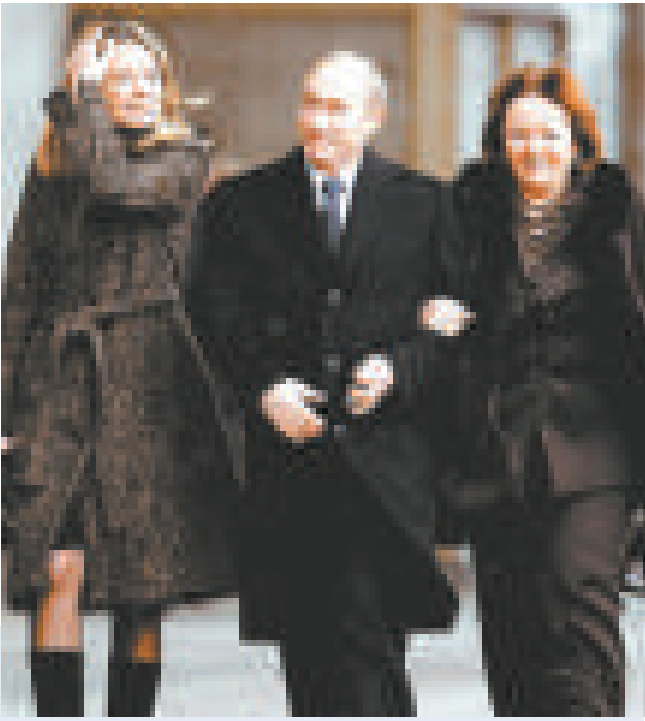
▲普京和太太（右）及二十三歲的長女

【本報訊】據俄羅斯媒體報道：衆所周知，俄羅斯總理普京與夫人育有兩個風華正茂的女兒。生於一九八五年的老大名叫瑪麗姬，今年二十三歲；生於一九八六年的老二名叫葉卡捷琳娜，今年二十二歲。出於對寶貝女兒安全的考慮，普京從未讓她們在任何媒體面前露過正臉。 然而近日，一位網名為「白癡」的俄羅斯網友卻在其個人博客上，將瑪麗姬與父母的正面合影發布了出來，一時間引起各家網站競相轉載。從照片上看，瑪麗姬一頭金髮、面容姣好，個頭比普京還要高挑。