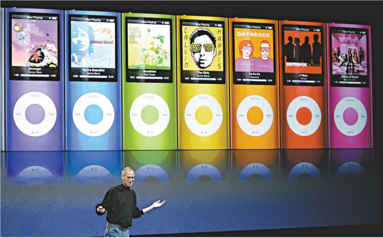
▲蘋果首席執行官喬布斯介紹更纖巧的 iPod 播放機

【本報訊】綜合報道：蘋果公司九日推出更纖巧的 iPod 媒體播放機，並調降觸控屏幕機種的價格百分之二十三，希望在假日購物旺季來臨之前，贏得看緊荷包消費者青睞。 蘋果首席執行官喬布斯在三藩市舉行的盛會上宣布，容量 8GB、設計更時髦的 iPod Touch 銷價，將從原先的二百九十九美元降到二百二十九美元。容量 16GB 的 iPod Touch 銷價，也從去年推出時的三百九十九美元降到二百九十九美元。 喬布斯還在現場展示容量從 8GB 提高到