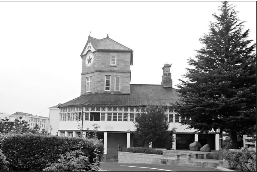
華民政務署和華勇營舊址 斯雄攝

進去後，兩位軍官熱情過來介紹情況，其實他們換防不久，對這些老建築並不了解。只是說，房子基本保持原貌，結構未動，現在改做圖書館和官兵生活用房，將近百年了，依然很牢固。司署前海，與劉公島對峙，原先前面沒有建築，視野相當開闊。看著華勇營房屋尖頂上鑲嵌的五角星，我問是否原來就有。一軍官肯定地說，是，原來就有，另一軍官則快生地告訴，好像原來是個鐘表。我猜測也應該是鐘表才合理。後查看威海老照片，果然是個大鐘表。我和陪同的人發感慨：這些舊址完全可以開發出來，弄成旅遊景點啊。對方也有同感。但他告訴我：這些舊址幸虧早就被軍隊佔用，才可能倖存至今。可現在這些都是軍產，要協調交給地方，需通過中央軍委，難度很大。而且，這些地方現在都處市中心位置，寸金寸土，光地皮就很貴的哦…… 陪同的人補充說，威海市區和劉公島上現在僅存的幾處英租時期的房屋舊址，大體都是這個情況。一部分軍隊仍在使用，一部分則完全棄置荒廢，相當可惜。 威海衛也有「九龍城寨」 讓我驚奇的是，英租威海衛居然也有一個城中之城，如同香港當年的九龍城寨。這就是威海衛城。 根據《租威海衛專條》，英國的租界範圍不包括威海衛。點五五平方公里，初期人口不足二千人，作為文登縣的一部分，仍歸中國管轄。英國並未強行佔有衛城，但在討論威海衛權力移交之初，即提出衛城裡行政官員的任免，必須事先征得英方同意。雖未被採納，但每任巡檢或辦事委員上任時，都先到殖民政府報到；一九〇〇年開始，殖民政府對在城內任職的主要官員，每月發放四十元津貼。有了這些「君子協定」後，一直到發安無事。 獨特的地理位置和管制方式，使得威海衛城與香港九龍城寨的狀況和名聲，差不多。 英租之後，威海衛城區的部分發展中心由城裡移至愛得華碼頭，城裡的生意大部分遷至城外。衛城蕭條之後，煙館林立、暗娼遍地，賭場比比皆是治安一片混亂，被英國人稱為「罪惡的魔窟」。而九龍城寨一樣，一直是殖民當局所頭疼，這僅僅是一種歷史的巧合，還是有某種故意？回歸之後，九龍城寨被改造成九龍城公園，而威海衛城在其後的城市改造中，已經完全看不見原貌了。 威海明天會更好 站在九龍半島尖沙咀由北向南眺望香港的繁華，是一道美麗的風景，所謂畫看，精華盡在青島島上。威海則正好相反，站在劉公島上由東向西看威海市區的景致，也有情趣繁華在市區，留給劉公島的更多是歷史。同樣位於半島上，威海的魅力在於它的靜謐與安逸，香港則在於其躁動與活力。在我看來，這一靜一動，都一樣讓人傾心。有趣的是，同在七月一日這一天，一八九八年，中英《租威海衛專條》簽定；一九九七年，香港回歸中國。 香港回歸時，人們說得最多的一句話是：香港明天會更好。一九三〇年十月威海衛回歸後，威海衛管理公署在當時的三角花園建有「收回威海衛紀念塔」，公園南門兩邊的楹聯寫的是：「遵循先覺路，灌溉自由花」，不知這兩句為何人所作，它要表達的僅僅是一種決心，和嚮往嗎？或許也是在指明一種方向，威海明天會更好的方向。 二〇〇八年八月二十五日下午於官園