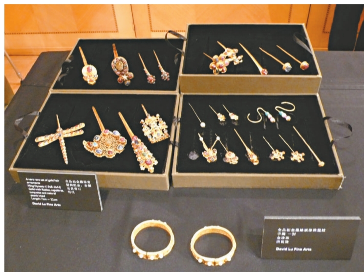
清乾隆「全副金鑲綠緞紋珍珠龍紋手鐲」一對（前）、明朝「全副金鑲珠寶髮飾組」，將在博覽會中展出

軒、季豐軒及嘉園現代藝術等。博覽會舉行期間，將同時舉辦多項展覽，包括「李華式當代水墨畫展」、「香港藝術中心三十周年獎——藝術邀請賽入圍作品展」、「香港藝術館之友私人珍藏展」、「中文大學藝術系展」等，並有一連串學術講座，講者包括舊金山亞洲藝術博物館館長許傑、亞洲藝術博物館中國藝術高級館長倪明昆等，討論亞洲藝術在國際藝壇上的新趨勢。