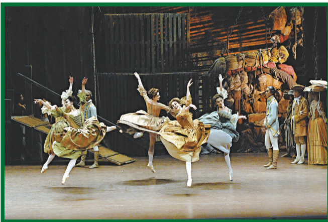
英國皇家芭蕾舞團的群舞者亦有出色表現，圖為《曼儂》的群舞場面

身為肯尼夫·麥美倫多部傳世傑作中主要角色及重點領舞的原演出者，蒙妮嘉·美臣對編舞家提出的動作要求細節、整體演出效果等多方面的準則格外體會深刻。