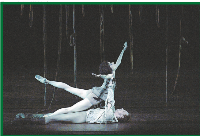
舞劇《曼儂》男女主角逃亡，在絕境中垂死掙扎的一幕

「要不要觀看過去演出的錄像完全是舞者個人的喜好。有些舞者不喜歡這樣做，另外一些舞者則十分喜愛觀看之前的表演錄像。他們進排練室之前，可以選取最切合己需要的方法，只要他們能順利完成排練，我並不介意他們採用哪一種方法。」