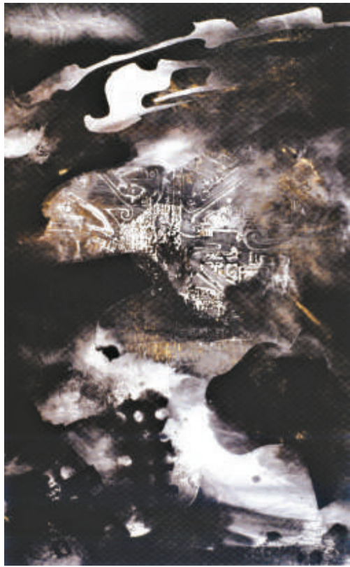
劉子健作品《垂麗之天象》——雕色

「2008中國當代藝術邀請展」日前在深圳揭幕，是次畫展獲得眾多當代美術界的中青年畫家參展，畫展的主流，為當代抽象的油畫藝術和水墨藝術作品。