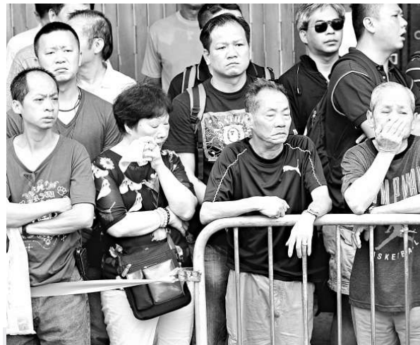
市民懷着悲痛心情送別英雄