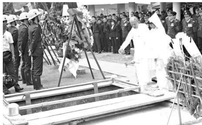
蕭永方長眠浩園