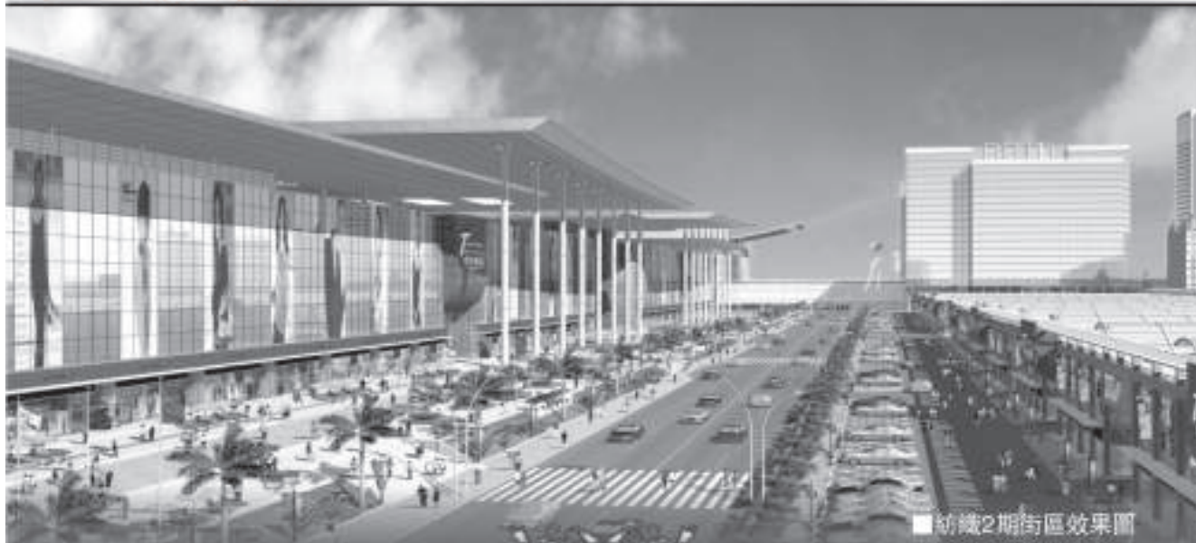
■紡織2期街區效果圖