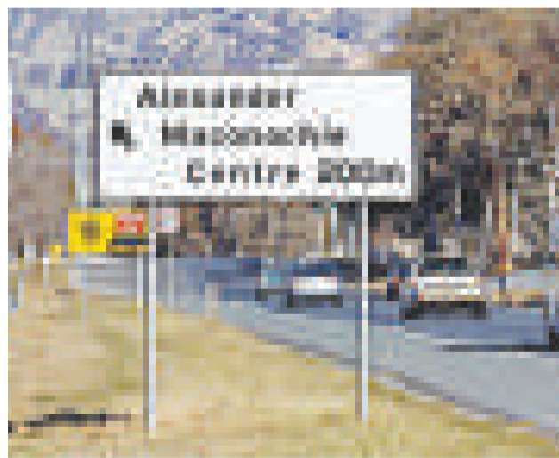
▲澳洲第一個依據人權標準打造的監獄落成

澳洲首都特區政府表示，這座監獄依照人權標準打造，以「給予犯人尊重，他們會更快改過向善」為出發點，首都特區檢察總長柯貝爾也表示，健康監獄的標準是，每個人(包括囚犯、獄方和探訪者)都感到安全，每個人都感到與人之間平等尊重。