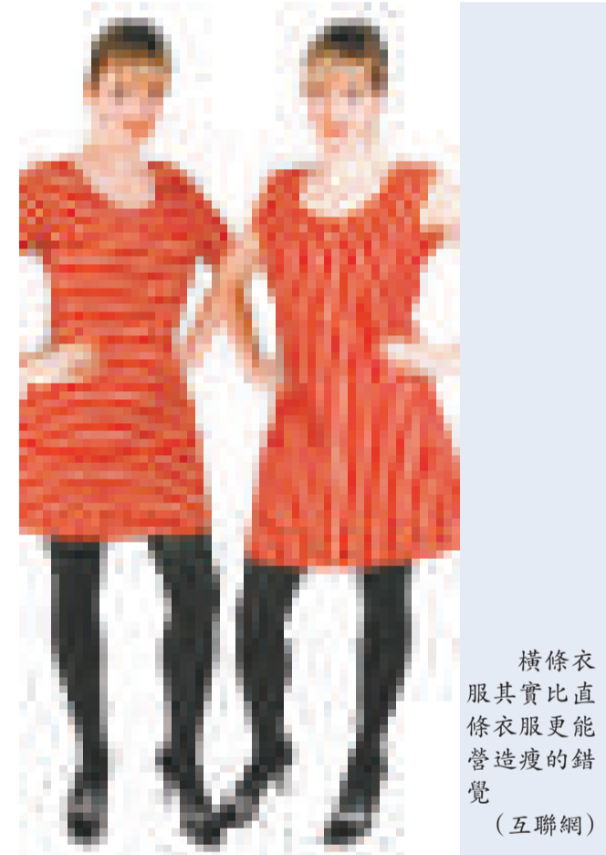
橫條衣服其實比直條衣服更能營造瘦的錯覺

令湯普森動念研究直條和橫條衣服效果的，是另一個關於認知的錯誤觀念。許多人指希臘神廟的圓柱中間凸出，是因為設計者想避免人們看見並排的圓柱時會產生柱子中間凹陷的錯覺。不過湯普森指圓柱並非是筆直而平行，不會產生錯覺。