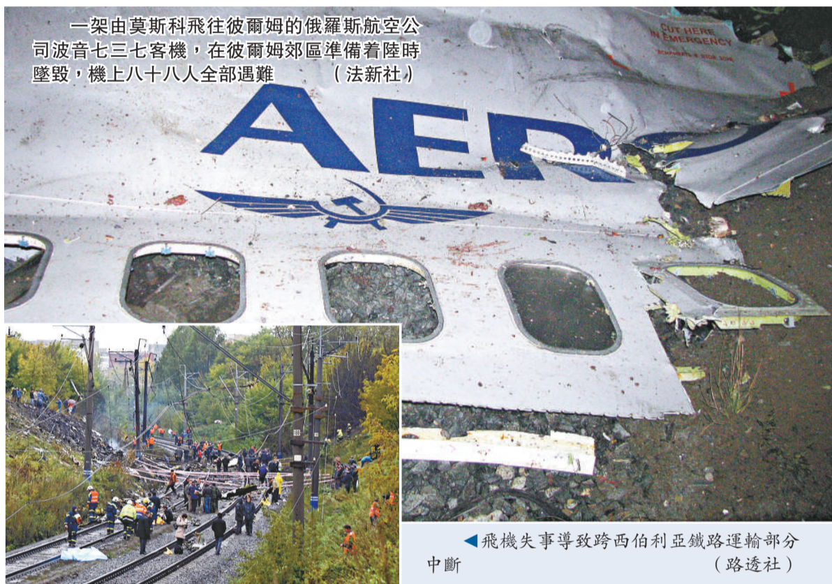
一架由莫斯科飛往彼爾姆的俄羅斯航空公司波音七三七客機，在彼爾姆郊區準備降陸時墜毀，機上八十八人全部遇難

而美國媒體引述俄當局說，這架飛機在即將降落前墜毀，沒有跡象顯示這是一次恐怖攻擊。俄緊急情況部發言人安德烈阿諾娃向俄媒體透露，波音七三七客機墜毀地點位於彼爾姆市西南部，該地區人煙稀少，飛機碎片散落在面積約為一萬平方米的區域內，該地區已被封鎖，目前未接到地面人員傷亡報告，俄緊急情況部載有搜救人員的運輸機已準備飛往失事地點。她說，飛機失事現場大火已被撲滅，有關人員已經展開搜救工作。