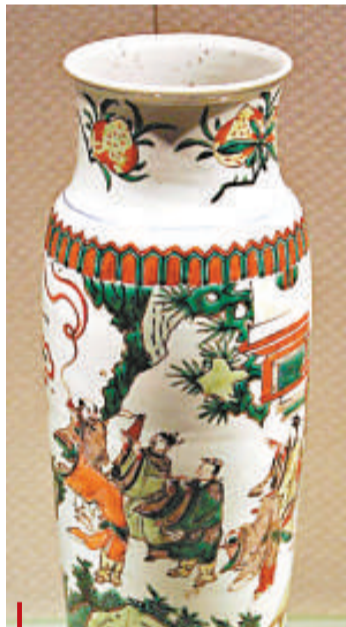
清順治五彩八仙一統瓶