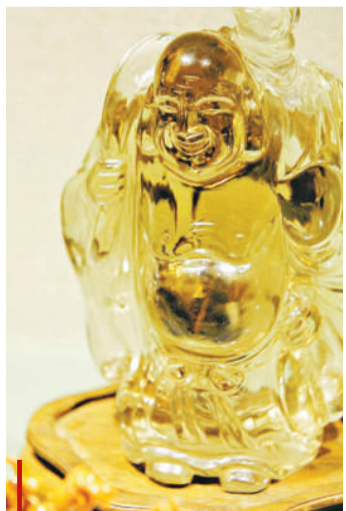
晚清水晶布袋和尚