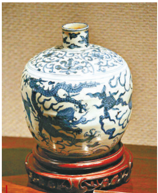
明萬曆青花雲龍小口瓶