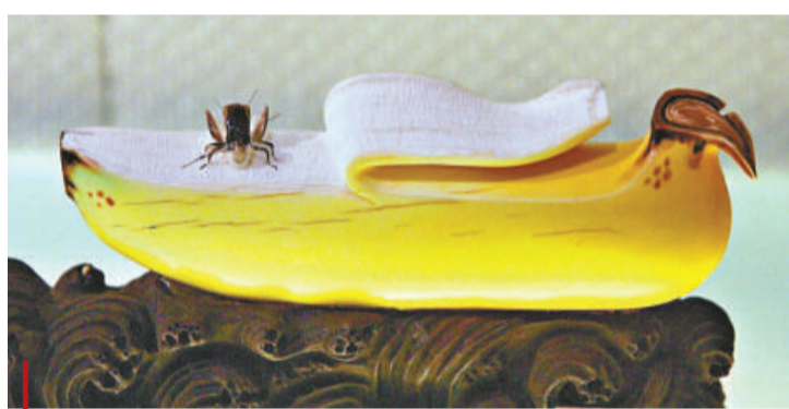
形神俱似的清代象牙雕《蟋蟀吃香蕉》