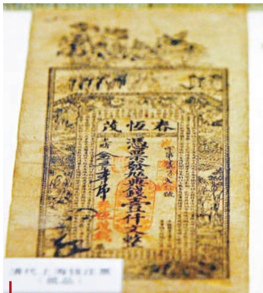
世界孤品清代票據現身上海

盛世收藏乃亙古不變之真理，當人們解決了溫飽問題後，開始有閒錢和心情玩收藏。自上世紀八十年代內地民間收藏蓬勃興起之後，上海的民間收藏活動方興未艾，目前約有50萬收藏大軍分布在全市的每一個角落，收藏者層次參差交叉，收藏的品種也是五花八門。