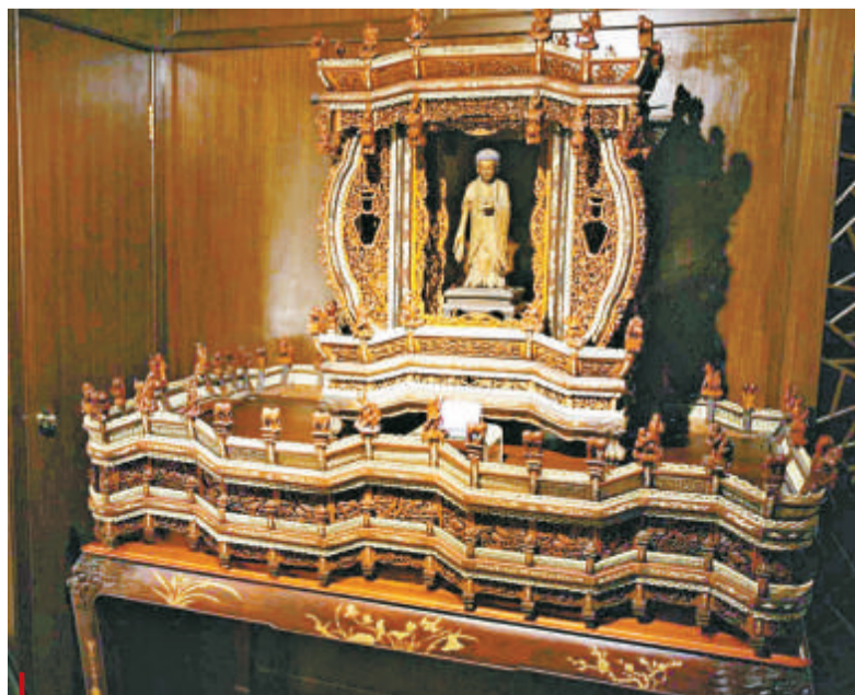
晚清黃楊木雕嵌骨大佛龕