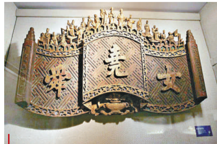
清光緒書卷冊頁區