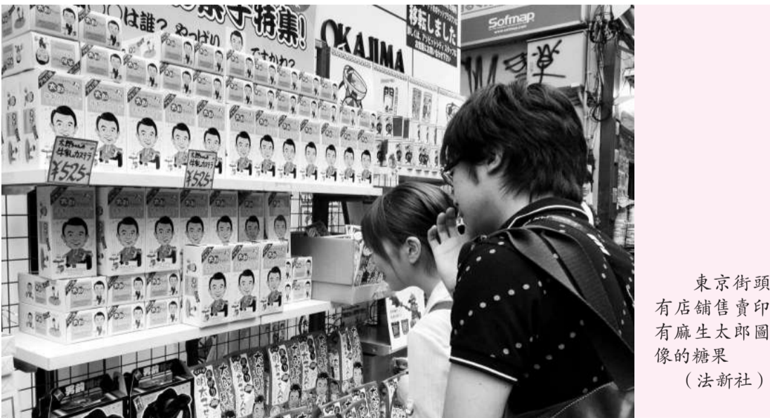
東京街頭有店舖售賣印有麻生太郎圖像的糖果

除了麻生和獲得前首相小泉純一郎支持的小池之外，另三名參選者為經濟財政部長與謝野馨、石原伸晃及前防衛大臣石破茂。石原伸晃是東京都知事石原慎太郎之子。