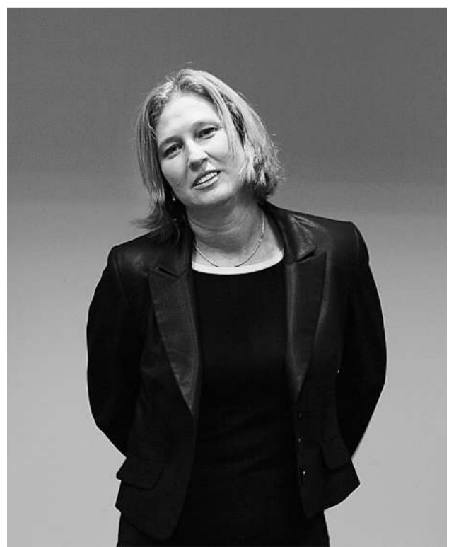
以色列外長利夫尼

利夫尼不是左翼分子。她的家族是猶太復國主義的支持者，她曾經加入以色列情報局「莫薩德」，她有自己「紅標線」——例如，反對即使只是象徵式地收容巴勒斯坦難民。她一直公開批評奧爾默特在大馬士革未有「結束其對恐怖主義的支持」之前，就與敘利亞展開談判的決定。