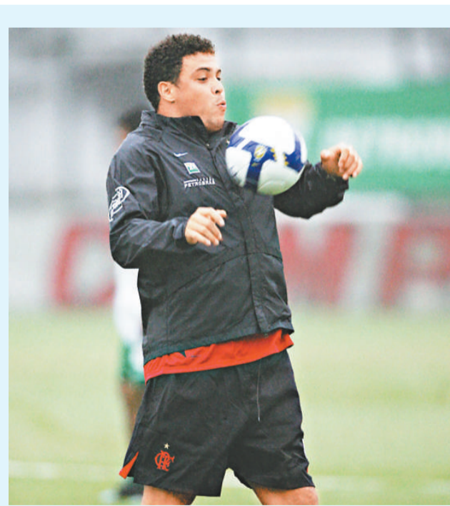
朗拿度加盟曼城的希望可能成泡影

【本報訊】綜合外電英國·曼徹斯特十六日消息：日前有報引述巴西球星朗拿度表示，自己已經與英超球會曼城達成協議，將在明年1月正式加盟該會。不過，曼城於周二卻否認其事，澄清雖然該會早前的確曾經和朗拿度接觸過，但如今已打消了羅致「大哨」的念頭。