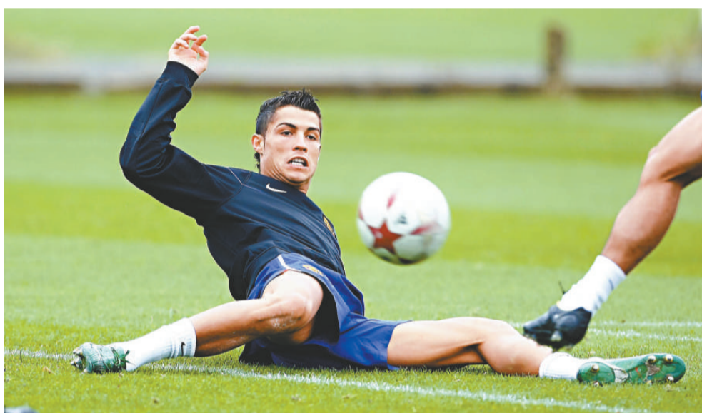
C朗拿度積極操練，準備今仗正式復出

對上一次能夠成功衛冕歐冠杯錦標的球隊是意甲AC米蘭，該隊在1989年及1990年連奪兩屆冠軍，但在歐冠杯於1992至93年度改制加入分組賽階段後，便沒有球隊能夠成功衛冕。不過，費格遜就決意要打破這個局面，他表示：「沒有球隊能夠連續兩季奪取歐冠杯錦標，證明要在此