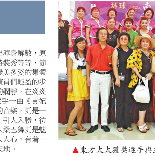
▲東方太太獲獎選手與主禮嘉賓合影留念

高更遠的目標不斷的邁著前進的步伐。正值好時節，百花齊怒放。演員們使出渾身解數，原創詩朗誦、民族舞、瑜珈、京劇、拉丁、時裝秀等等，節目精彩紛呈，掌聲不斷、精彩連連。一段優美多姿的集體舞《太極蓮花扇》為本次活動拉開帷幕，演員們輕盈的步伐伴著歡騰的曲調，給人們一種徜徉藝術的嫺靜，在炎夏末裡如清泉般透露絲絲涼爽；F004號選手一曲《貴妃醉酒》一招一式、一顰一笑，契合著優雅的音樂，更是一場無與倫比的視覺藝術的享受。情景濃潤，引人入勝，彷彿進入大唐盛世般眼前一片妖嬈多彩；雙人桑巴舞更是魅力無限，熱辣引燃全場；東方太太已經深入人心，有着一一定的影響力和知名度，正在走向更廣闊的天地。