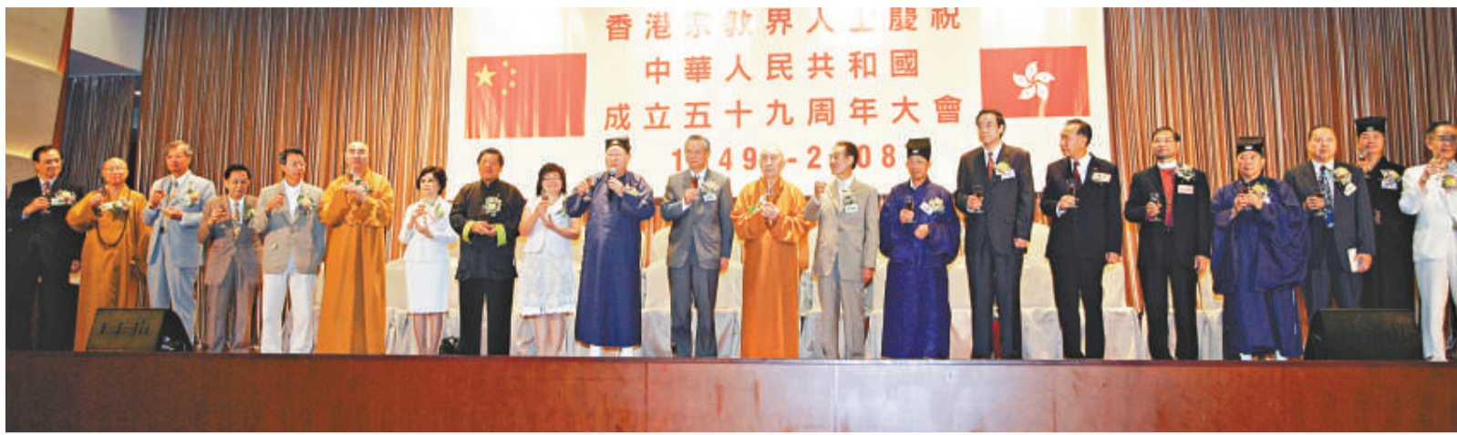
▲本港各大宗教首長為中華人民共和國成立59周年而乾杯