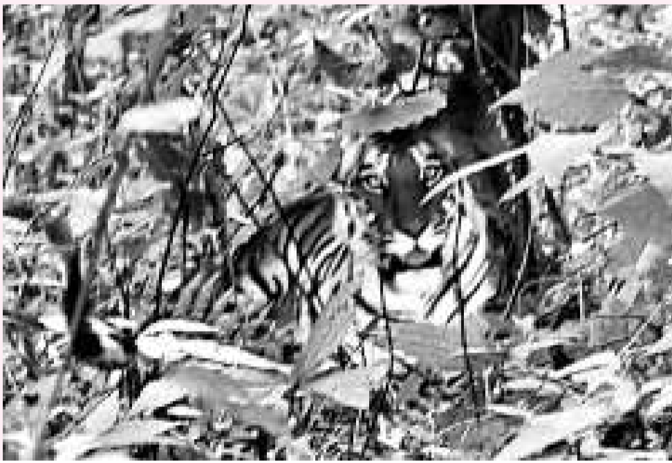
▶被證實是偽造的華南虎照片 (資料圖片)