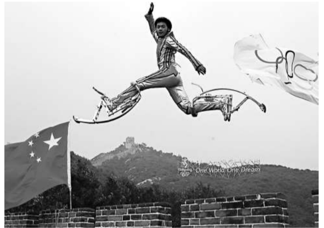
少林塔溝武校學員在基地訓練中