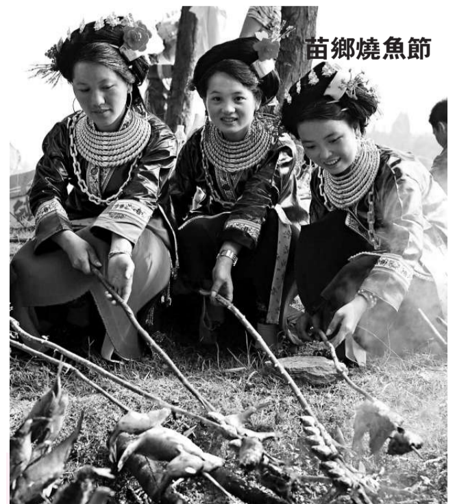
9月17日，是廣西融水縣高村傳統的「燒魚節」，圖為苗族姑娘在燒魚。

同時，使用海域應當按照國家和自治區的有關規定繳納海域使用金。擅自將海域用途改變為圍海型項目用海，或擅自將海域用途改變為填海型項目用海，以及其他擅自改變海域用途的，由縣級以上人民政府海洋行政主管部門責令限期改正，並沒收違法所得，處以罰款；對拒不改正的，由頒發海域使用權證書的人民政府註銷其海域使用權證書，收回海域使用權。規定將從10月1日起施行。 (本報記者劉迎南寧十八日電)