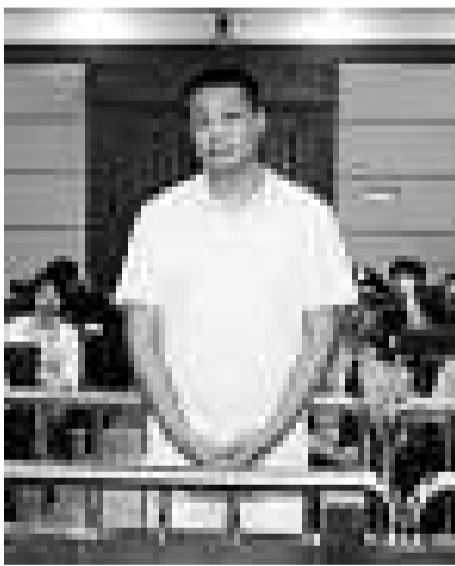
石雪在庭上 (資料圖片)

針對此案判決，有言論指，「如果貪污10萬判即行死刑，2.6億判死緩，中國未來的貪官們又何苦甘於「清貧」？甚至有評